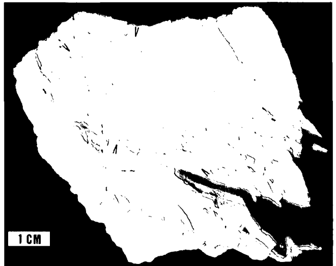
Abb. 2. Pseudobrekziöser Wettersteindolomit von Wildalpen, Steiermark (Lok. Rauchmauer, Ortsrand Wildalpen). Grau = weitgehend unveränderter Wettersteindolomit; weiß = dolomitischer Kalzit entlang von Mikroklüften. Der Verlauf einzelner Mikroklüfte ist in stark zersetzten Partien oft nur noch an den linear angeordneten „Lücken“ der Dolomitrelikte zu erkennen (s. Pfeile).

Da die Kalzitisierung des Wettersteindolomits von Klufflächen ausgeht, ist sie als posttektonisch einzustufen. Eine allzu oberflächennahe Umbildung erscheint allerdings unwahrscheinlich, da die Lösungsgeschwindigkeit von Dolomit unterhalb von ca. 50°C rasch auf minimale Werte abnimmt (USDOWSKI, 1967), wohingegen der Kluffkalzit nahe der Erdoberfläche selbst der Verkarstung anheimfällt. In Frage kommen wohl meteorische, an tektonischen Trennflächen eindringende Grundwässer, die ihren \text{Ca}^{2+} -Gehalt möglicherweise aus der Verkarstung hangender, inzwischen abgetragener Kalksteinformationen (z.B. Cidariskalke, Dachsteinkalke) bezogen. Die Kalzitierungs-