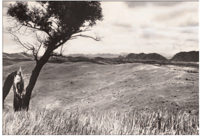
Im Meratos-Gebirge in Ost-Borneo. Die dunkle Kulisse bilden Lepidocyclinen-Kalke am Ostrand der Barito-Ebene, dahinter Metamorphikum mit Diamanten führenden Peridotiten. Aus H. KÜPPER's Nachlass.

Die drei Wochen dauernde Schiffsreise Genua – Port Said – Colombo – Belawan (Nord Sumatra), die Eindrücke im Roten Meer, im Indischen Ozean, am Edelsteinmarkt Colombo und schließlich die überwältigende Tropenvegetation um den Hafen an der Nordspitze von Sumatra ließen Europa langsam, aber vollstän-