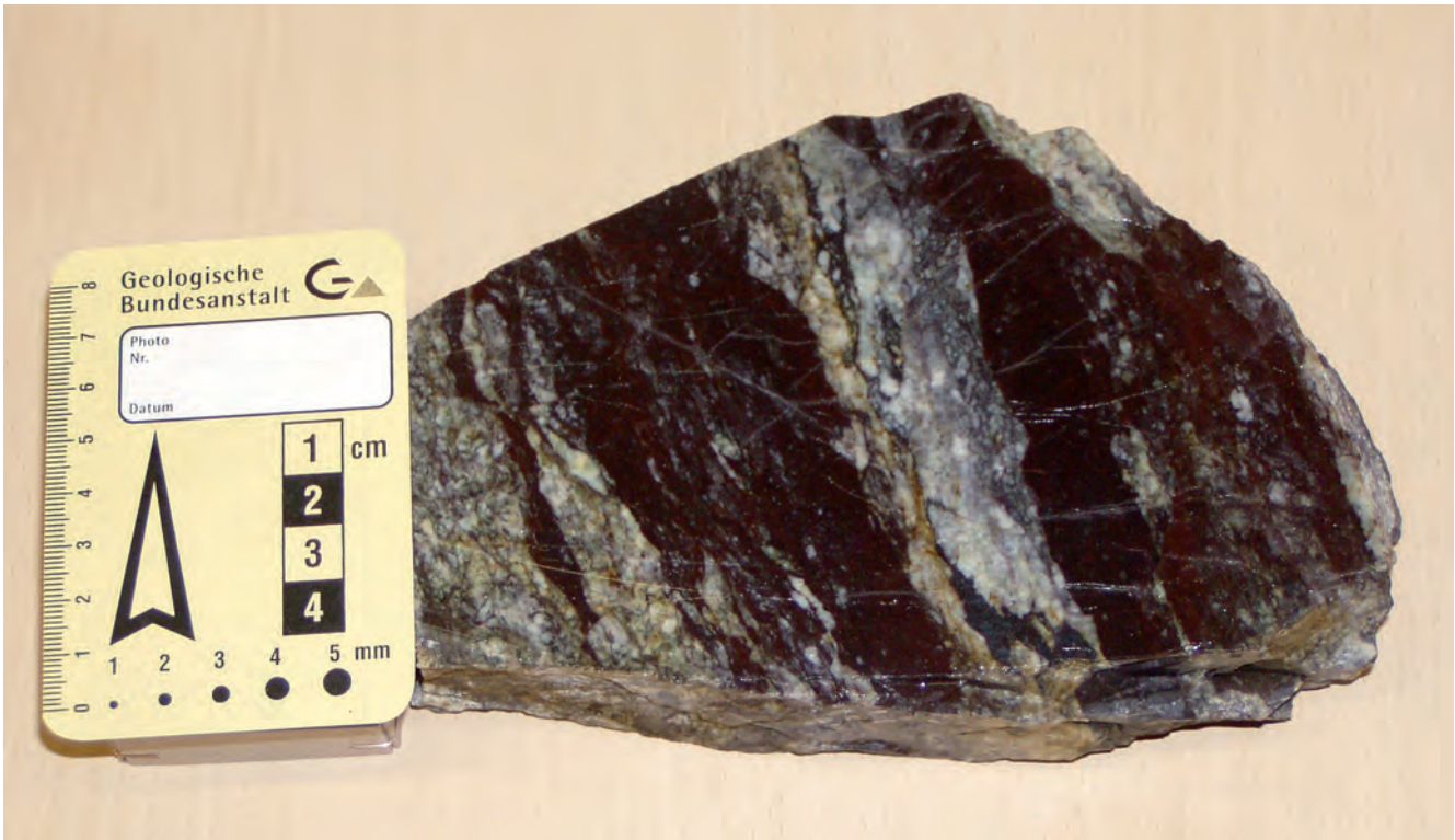
Abb. 1. Angeschnittenes Teilstück des am 31. August 2013 im Görtschachwinkel gefundenen Pseudotachylits.

Wie aus Abbildung 1 ersichtlich, besteht das Fundstück zu gut 60 Vol.-% aus einer extrem feinkörnigen oder amorphen Masse, deren vorherrschende Farbe dunkelgrau bis fast schwarz ist, und die an wenigen Stellen leicht ins Rötliche geht. Das restliche Gesteinsvolumen (knapp 40 %) besteht aus kataklastisch beanspruchtem, vorwiegend klein- bis mittelkörnigem, gneisartigem Material mit relativ hohem Feldspatgehalt, das in annähernd parallelen, bis ca. 3 cm mächtigen Lagen zwischen den dunklen Gesteinspartien auftritt. Ob es sich bei den hellen, feldspatreichen Lagen um einen durch partielle Aufschmelzung gebildeten Restit oder um ein Nebengestein mit nur wenig verändertem Mineralbestand handelt, ist makroskopisch nicht zu erkennen.