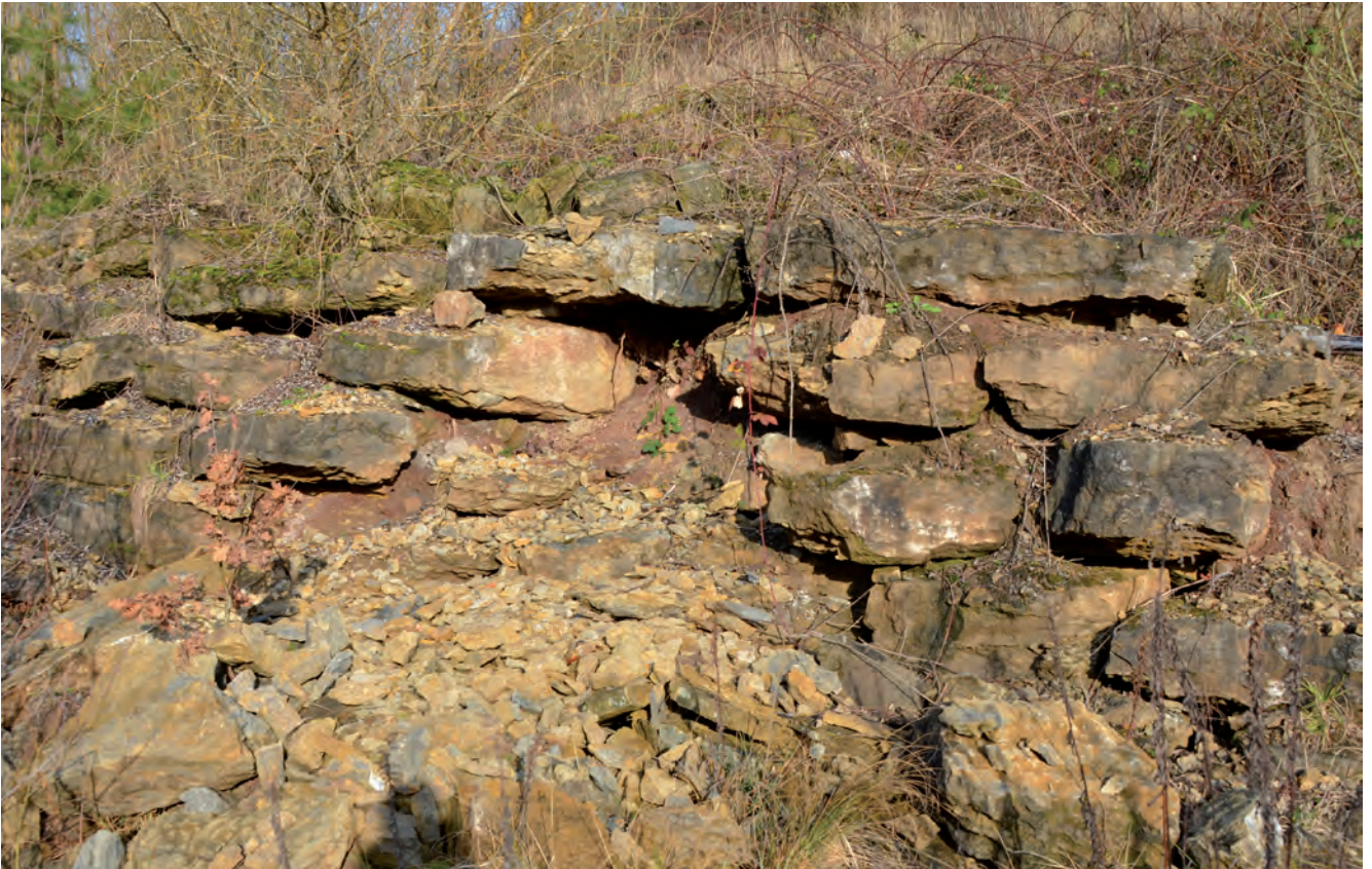
Abb. 11. Die Schichten des oberen Rhätium, d.h. die des Contorta-Sandsteins im selben Steinbruch wie in Abbildung 10.