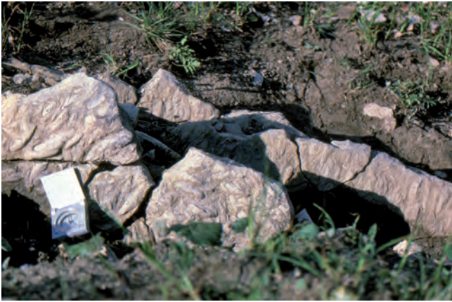
Abb. 8. Die grauen Bivalven-reichen Lumachellekalken des Hochalm-Members, voll mit Gervillia inflata (SCHAFHÄUTL), vom Hochalm in der Umgebung von Unken, Salzburg.