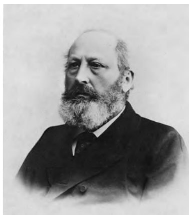
Abb. 1b. Eduard Sueß in seinen fortgeschrittenen Jahren, gegen Ende des 19. Jahrhunderts (Foto aus: KANN, 1974).

seiner Autobiografie (SUESS, 1916) fast ausschließlich von seiner sozialen und politischen Tätigkeit erzählte und nur kurz sein wissenschaftliches Wirken schilderte, erschwert noch mehr das Unternehmen eines potenziellen Biografen.