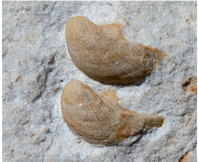
Abb. 9. Ein Bild von Rhaetavicula contorta (PORTL.) aus den Sammlungen des Staatlichen Museums für Naturkunde in Stuttgart (Nummer: SMNS Nr. 21345) im Rhätsandstein (Exter-Formation) von Nürtingen (für eine geologische Karte, vgl. BERZ, 1940; für die Erläuterungen: BERZ, 1936: 13–17), Breite der Einzelklappen je 23 mm (mitgeteilt von Günter Schweigert via Hartmut Seyfried). Die Steinbrüche im südwestlichen Teil des Blatts 7322 Kirchheim und Teck der geologischen Karte von Baden Württemberg 1:25.000 sind die historischen Stellen, wo das Vorhandensein des Rhätium zum ersten Mal durch die Funde von Avicula contorta (jetzt Rhaetavicula contorta (PORTL.)) nachgewiesen wurde.

des Vorkommens in Schwaben von Cardium Rhæticum (eine Herzmuschel), Avicula contorta (heute: Rhaetavicula contorta ; eine Miesmuschelart, Abb. 9) und Pecten Valoniensis (heute: Praechlamys valoniensis (DEFrance 1825); eine Art von Jakobs- oder Pilgermuschel) 24 , die auch in den Kössener Schichten der Ostalpen vorkommen (OPPEL & SUESS, 1856: 543) 25 .