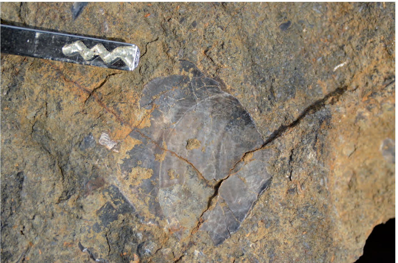
Abb. 12. Detail aus dem Contorta-Sandstein, d.h. der eigentlichen schwäbischen Kloake.