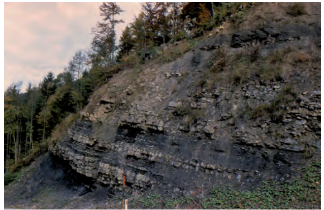
Abb. 7. Aufschluss der unteren Kössener Schichten (= Hochalm-Member) nahe Gaisau (ca. 20 km südöstlich von Salzburg), nordwestlich vom Dachsteinplateau (siehe auch: KUSS, 1983). Diese Aufschlüsse liegen in der Nähe, wenn sie nicht sogar ident mit jenen sind, die Sueß seinerzeit studiert hatte. Die schwarzen, weichen Tonlagen sind fossilarm, haben organischen Kohlenstoff, sind aber nicht bituminös. Es handelt sich um Stillwasserbildungen einer seichten lagunenartigen Rampe; sie wechsellagern mit grauen bivalvenreichen Lumachellenkalken (siehe Abb. 8), die Sueß zum Namen „Schwäbische Fazies“ (nach den außeralpinen, süddeutschen Vorkommen dieser Bivalven in der Germanischen Trias) inspiriert haben.

sen auf den Fildern: vgl. GROSCHOPF, 2004; SIMON, 2005: 24–26) und unter (Umgebungen von Nürtingen: vgl. BERZ, 1936, 1940) dem „Bonebed“ (= Knochenbett oder Knochenschicht; Friedrich August von Quenstedts „schwäbische Kloake“ 22 bzw. Oppels „Grenzbreczie“: Abb. 6) 23 in Schwaben mit den Kössener Schichten der Ostalpen (Abb. 7, 8) zu parallelisieren seien, und zwar wegen