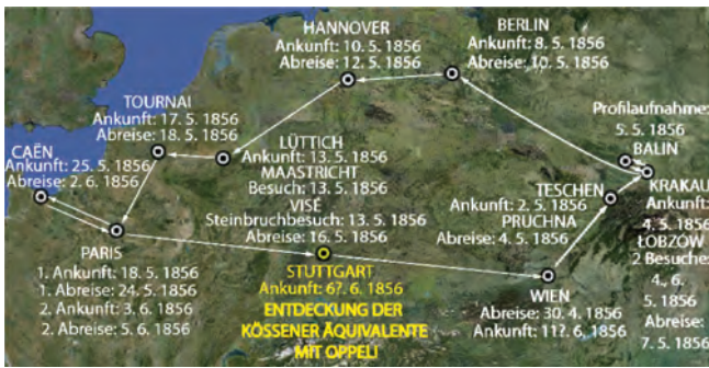
Abb. 4. Vereinfachte Itinerarkarte mit den Stationen der Reise von Eduard Sueß von Ende April 1856 bis etwa Mitte Juni 1856.

chen. Dort hatte man viele Versteinerungen der Jura-Zeit gefunden, die erstaunliche Ähnlichkeit mit solchen der Normandie zeigten. Da auf wichtige Anhaltspunkte für die Verbreitung der Meere der Jura-Zeit gehofft werden durften, sollte ich von Balin mich nach Caën in der Normandie begeben, um dort die entsprechenden Sedimente kennen zu lernen.“