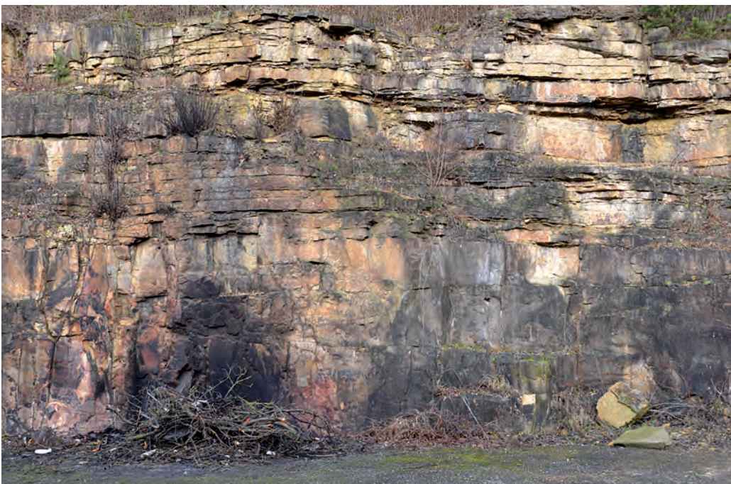
Abb. 10. Die Schichten der oberen Trias in dem alten Steinbruch bei Pfrondorf. Şengörs Fingerspitzen zeigen die Rhätium/Lias-Grenze.