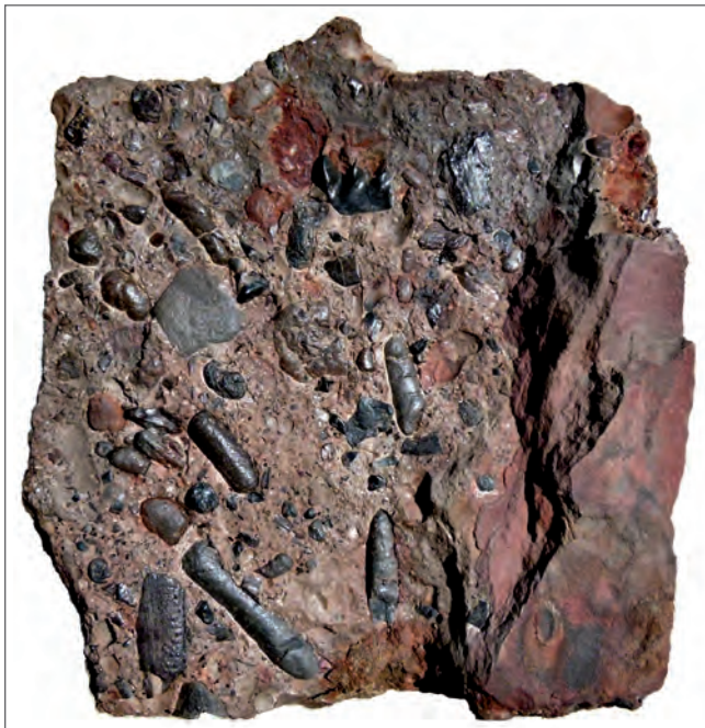
Abb. 6. Der berühmte Rhätische Bonebed oder Oppels Grenzbreczie. Dieses Bild stammt von Günter Schweigert vom Museum für Naturkunde in Stuttgart. Das Originalhandstück wird dort unter der Sammlungsnummer SMNS 54059/1 aufbewahrt. Es stammt von der Lokalität Birkengehren bei Esslingen-Wäldenbronn. Breite: 17 cm, Länge: 18 cm. Mitgeteilt von Hartmut Seyfried (Stuttgart).

Das Hauptanliegen der Arbeit ist, zu beweisen, dass die Muschel führenden Schichten gleich auf (bei Neuhaus