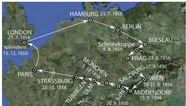
Abb. 13. Vereinfachte Itinerarkarte mit den Stationen der Reise von Sir Charles Lyell im Jahr 1856.

„Dabei trat mir neuerdings die Mannigfaltigkeit unseres Reiches und namentlich die außerordentliche Verschiedenheit einer südlichen Gesteinsfolge (Alpen und Karpathen) von einer nördlichen (böhmisches Masse, Sudeten, galizische Ebene) vor Augen. So großen Gegensatz kannte man damals kaum an anderer Stelle der Erde und nament-