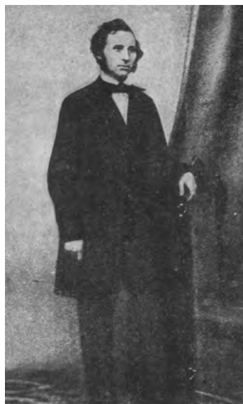
Abb. 1a. Der junge Eduard Sueß, wahrscheinlich in den Jahren, als er am k. k. Hof-Mineralien-Cabinet als Paläontologe arbeitete (1852–1857). Das Bild ist aus der Biografie von Sueß von Wladimir Afanasiewitsch Obručev (OBRUČEV & ZOTINA, 1937).

Ein Jahrhundert nach seinem Tod besitzen wir immer noch keine befriedigende Biografie von Eduard Sueß (1831–1914), einem der größten Geologen der je gelebt hat (Abb. 1a, b). Dies hat verschiedene Gründe, die ich an anderer Stelle angeführt habe (ŞENGÖR, 2009a): Sueß hat nicht nur die meisten seiner Freunde und Kollegen, sondern auch die besten unter seiner Schülern überlebt. Er starb wenige Monate vor dem Ersten Weltkrieg, der sowohl die Gelehrtenrepublik in Europa als auch den Staat, in dem Sueß großgeworden 1 war und gewirkt hatte, zerstörte. Nach diesem Weltbrand normalisierten sich die sozialen Bedingungen in seinem Vaterland kaum, erst nach dem Ende der alliierten Besatzung im Jahr 1955, die der Katastrophe des Zweiten Weltkrieges gefolgt war, kam es zu einer Beruhigung der politischen und sozialen Lage. Dann war aber die Mode der großen „victorianischen“ Biografien leider schon längst vorbei. Wenn jemand trotzdem bereit wäre, ein großangelegtes „Leben“ von Sueß nachzuzeichnen, sind heute die meisten dazu erforderlichen Materialien wie Briefe, Bilder usw., unter den sich in verschiedenen Weltteilen, von Wien und Basel bis nach San Diego und San Francisco in den Vereinigten Staaten befindenden Familienzweigen entweder verstreut oder bereits verschollen.