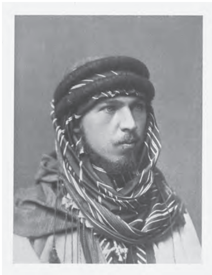
Abb. 2. Carl Diener während seiner Libanonreise, 1885 (DIENER, 1929: 16).

ein überaus ambitionierter wie passionierter Bergsteiger (FISCHER, 1929; DIENER, 1929). Bereits die selbst erwählte Belohnung für die mit Auszeichnung bestandene Matura bildete eine längere Wanderung durch die Gebirgswelt Salzburgs, Tirols und Kärntens (AMPFERER, 1928: 90; DIENER, 1929: 20, 53ff.). Den Alpen blieb Diener auch als Vereinsfunktionär verpflichtet: In den Jahren 1888 bis 1893 bekleidete er etwa die Funktion des Präsidenten im 1878 gegründeten Österreichischen Alpenklub, zudem wurde er 1912 zum Ehrenmitglied des noch elitärerem, bereits 1857 gegründeten britischen Alpine Club ernannt, was Diener selbst als „die höchste Auszeichnung“ begriff, „die einem Bergsteiger verliehen werden kann“ (DIENER, 1929: 44) 3 .