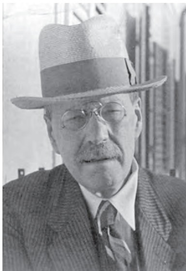
Abb. 1. Franz Eduard Suess (1867–1941) im August 1940.