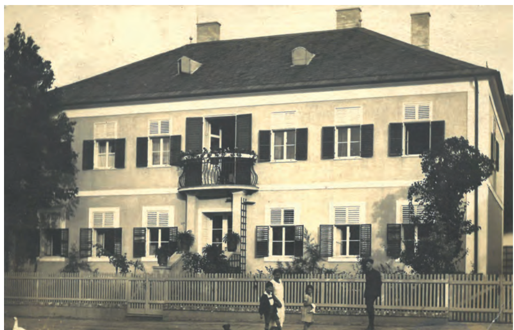
Abb. 3. Die Suess-Villa in Marz (Postkarte aus 1925, Privatsammlung Albert Schedl).