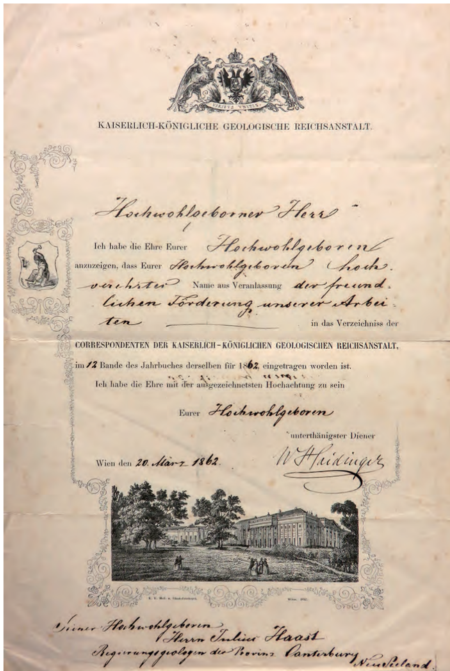
Abb. 2. Haasts Ernennung zum „Correspondenten“ der k. k. Geologischen Reichsanstalt vom 20. März 1862, mit Unterschrift Haidingers (Alexander Turnbull Library, MS-Papers-0037-20-3).

sungen und Erkundungen durch Ferdinand von Hochstetter, der auf der Novara genau einen Tag nach Haast in Auckland angekommen war und mit diesem über viele Monate gemeinsam Exkursionen unternommen hatte, konnte Hochstetter nach seiner Rückkehr Haast in wissenschaftlichen Kreisen und Gesellschaft bekannt machen und dazu beitragen, dass Haast in das Netzwerk aufgenommen wurde, welches die Grundlage für eine wissenschaftliche Beziehung zwischen Österreich und Neuseeland war. Diese Beziehung war eine freundschaftlich-kollegiale wie aus der hier vorgestellten Korrespondenz ersichtlich wird, wobei diese Briefe auch unmittelbar den Beitrag und Einfluss aus Wien bezeugen.