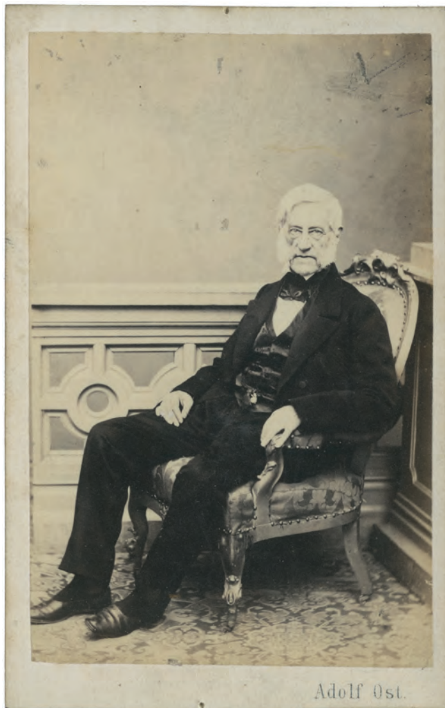
Abb. 4. Wilhelm von Haidinger.

Der Name Haidinger findet sich dank der Initiative von Haast auch in der Bezeichnung von Mount Haidinger 3.068 m (Abb. 5) in den südlichen Alpen Neuseelands wie-