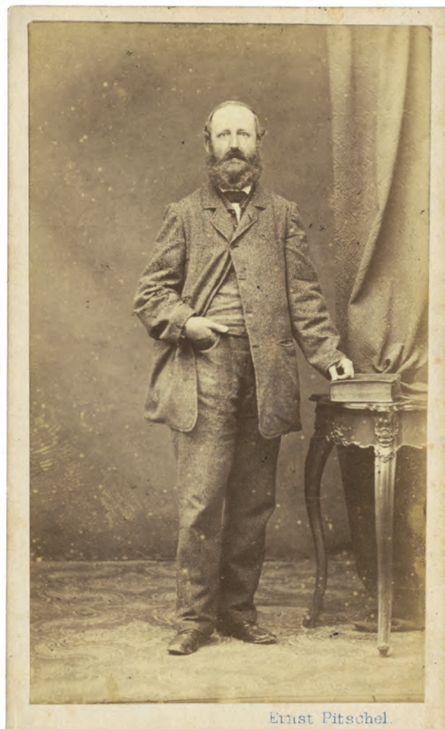
Abb. 8. Franz von Hauer.

Mit lebhaftem Vergnügen erhielt ich Ihre freundlichen Zeilen vom 6 April und durch denselben die Veranlassung in Direktem Verkehr mit einem hochgeehrten Fachgenossen zu treten, der uns Allen hier nicht allein durch seine wissenschaftlichen Leistungen, sondern insbesondere auch durch die Erzählungen Hochstetters längst befreundet ist.