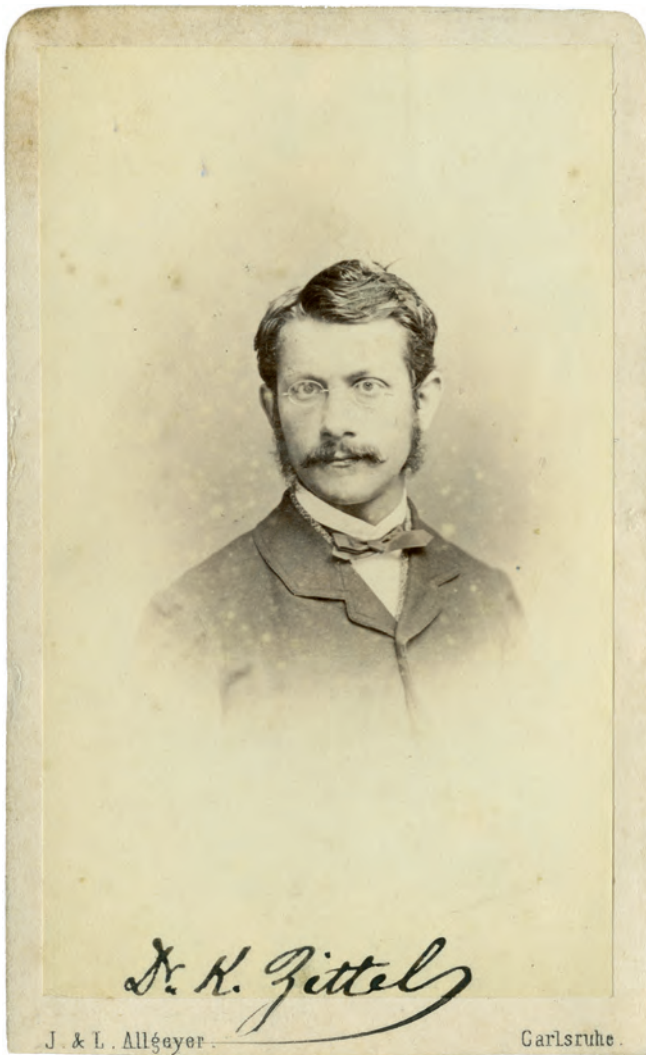
Abb. 11. Karl von Zittel.

Sie stellen unserem Museum weitere Moa Knochen in Aussicht. Wäre es wohl möglich die Auswahl so zu treffen, daß sich ein Skelet zusammenstellen ließe?