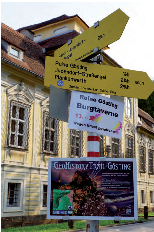
Abb. 2. Informationstafel des „GeoHistoryTrail-Gösting“ am Schlossplatz in Gösting (im Hintergrund das 1724 bis 1728 erbaute Schloss Gösting). Die grafische Gestaltung der Tafel wurde von FRITZ MESSNER, Feldkirchen, durchgeführt.

Mit einer Länge von 4,3 km und einer Gesamtanzahl von 28 Stationen ist dieser Wegverlauf der umfangreichste bezüglich der Informationen und der Entfernung. Der Startpunkt befindet sich bei der Bushaltestelle Thalwinkel am Fuchsloch und führt die Nutzerinnen und Nutzer der mobilen App in die Thematik ein. Danach geht es etwa 3 km entlang des Forstweges Attems, westlich des Frauenkogels, am St. Annabründl vorbei bis zur Burgruine, wobei sich 14 Stationen in der unmittelbaren Umgebung der Burg bzw. direkt in der Burgranlage befinden. Bei den Stationen „Aufschlüsse Forstweg Attems“ werden insgesamt drei unterschiedliche geologische Aufschlüsse behandelt. Die Stationen innerhalb der Burgranlage sind identisch mit den