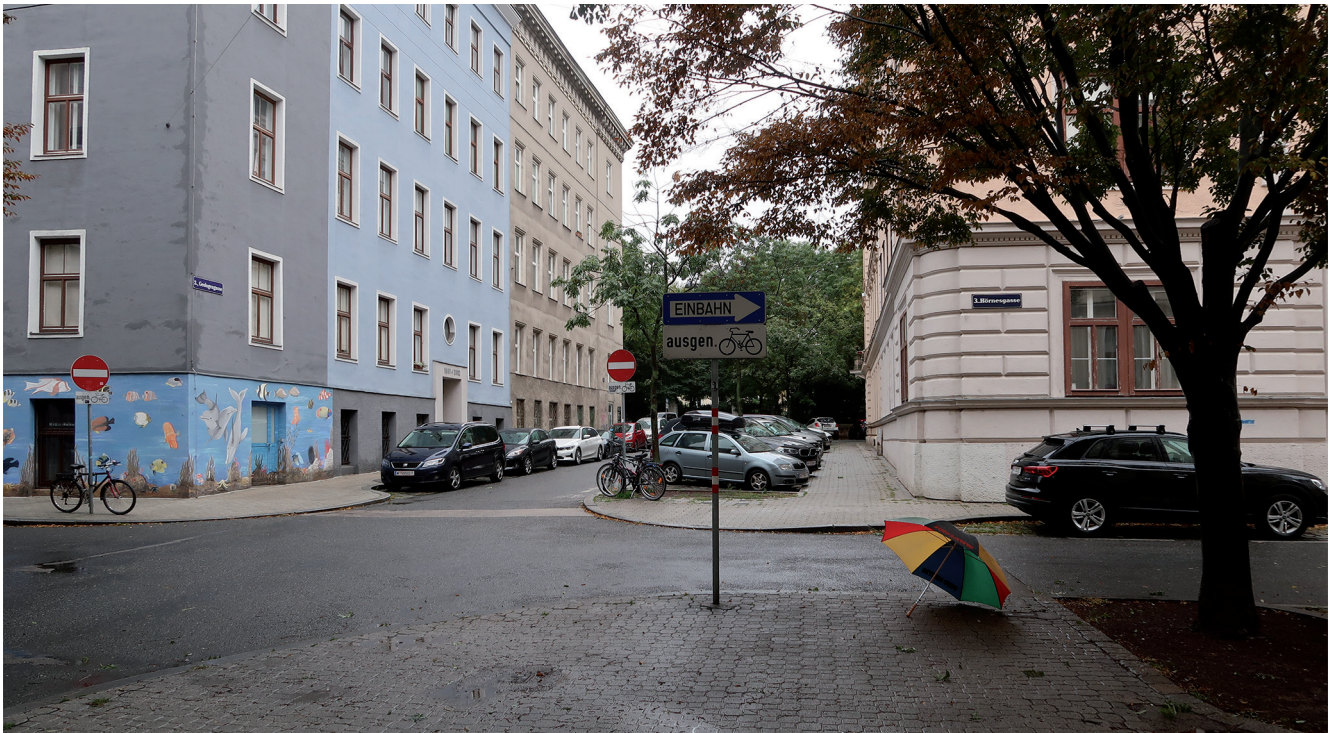
Abb. 2. Blick in die Geologengasse in Wien-Landstraße (3. Bezirk) Richtung Garten des Palais Rasumofsky mit der querverlaufenden Hörnesgasse.

1858), der das Palais 1838 von der Witwe Rasumowskis erworben hatte. Dem Palais angeschlossen waren weitläufige Gärten, die in dem zu Mitte des 19. Jahrhunderts noch keineswegs eng verbauten 3. Wiener Gemeindebezirk bis zur Erdberger Lände reichten und unter der allgemeinen Bezeichnung „Lichtenstein-Park“ bekannt waren. Eben diese Gartenflächen wurden 1876 parzelliert und baulich erschlossen. In dem so entstandenen „Stadtentwicklungsgebiet“ entstanden die Geusaugasse , die Hießgasse , die Parkgasse , die Hörnesgasse (sic! siehe weiter unten) sowie „mit Rücksicht auf die Nähe der geologischen Reichsanstalt“ auch die Geologengasse („NEUES FREMDEN-BLATT“ vom 03.01.1875: 11). Geologengasse und Hörnesgasse lagen zunächst am jeweils anderen Ort, noch 1876 tauschten sie die Plätze, da diese Änderung, wie Gemeinderat Weißenberger namens der 2. Sektion des Wiener Gemeinderates erklärte, „durch örtliche Umstände geboten“ sei („FREMDEN-BLATT“ vom 04.10.1876: 5). Offensichtlich wurde es als unglücklich angesehen, dass die am Haupteingang des Palais vorbeiführende Straße gerade nicht Geologengasse hieß, sondern nach einem einzelnen Geologen – Moriz Hörnes (auch Hoernes) dem Älteren (1815–1868) – benannt worden war.