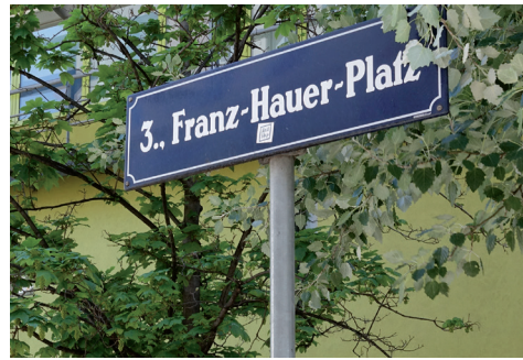
Abb. 4. Der Franz-Hauer-Platz befindet sich vor dem Gebäude der Geologischen Bundesanstalt mit der Adresse Neulinggasse 38 in Wien-Landstraße (3. Bezirk).

Auch die folgenden Direktoren sollten keinen Niederschlag im österreichischen und Wiener Straßennamenbild finden. Die 1898 benannte Stachegasse in Wien-Meidling (12. Be-