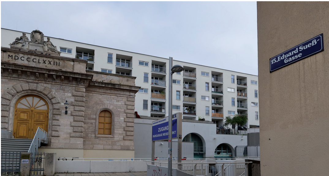
Abb. 6. Die Eduard-Suess-Gasse in Wien-Rudolfsheim-Fünfhaus (15. Bezirk) beginnt bei der Felberstraße und mündet direkt gegenüber der 1873 errichteten Alten Schieberkammer in die Meiselstraße.

1780 (Testacea Musei Caesarei Vindobonensis) mit handkolorierten Zeichnungen von Franz Joseph Wiedon stellt nach wie vor ein herausragendes Objekt der 3. Zoologischen Abteilung des Naturhistorischen Museums Wien dar (RIEDL-DORN, 1998: 38; 2019: 223).