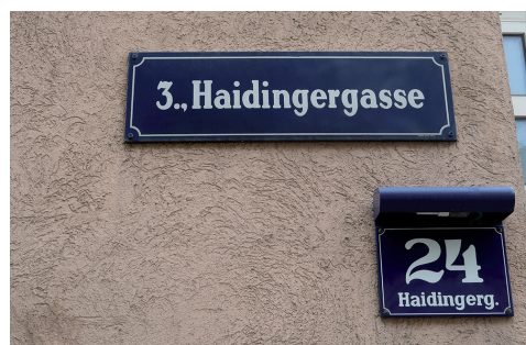
Abb. 3. Die Haidingergasse in Wien-Landstraße (3. Bezirk) verbindet die Erdberger Lände am Donaukanal mit der Erdbergstraße.

Haidingers Nachfolger an der Spitze der Reichsanstalt, Franz von Hauer (1822–1899), hat die ihm gewid-