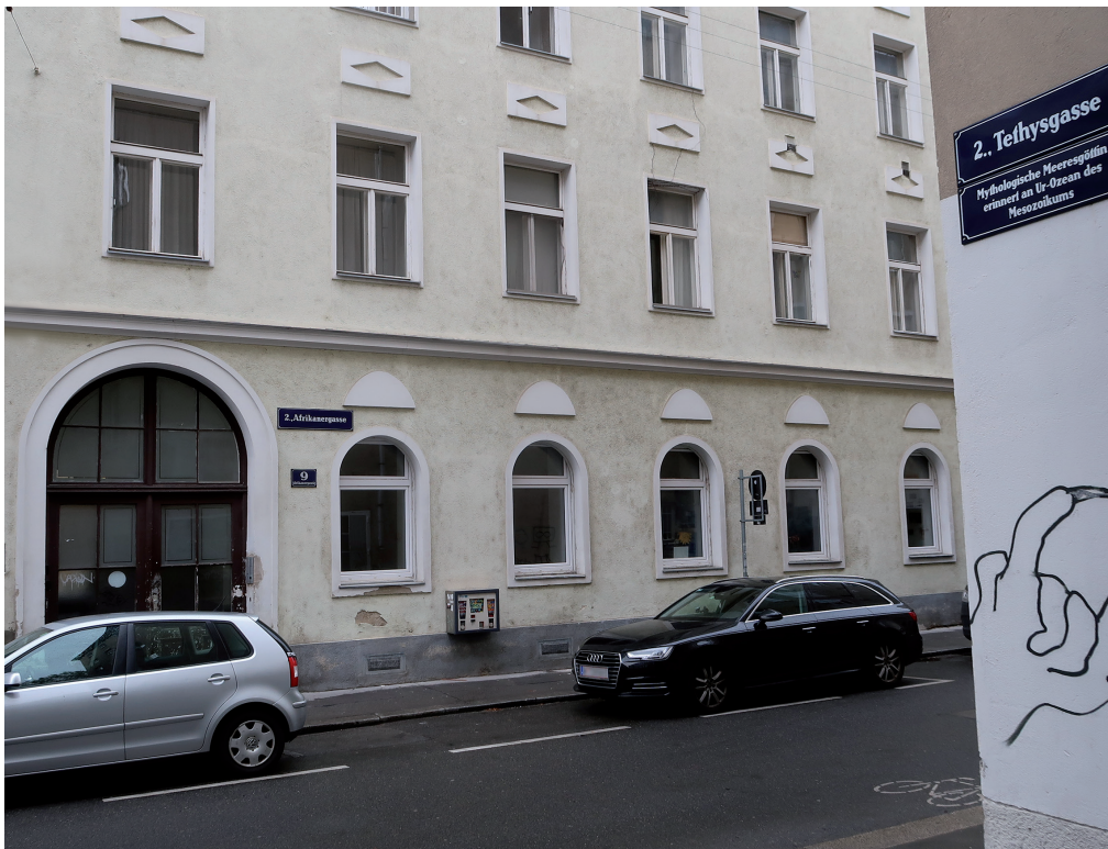
Abb. 1. Die Tethysgasse in der Leopoldstadt (2. Bezirk) verbindet als kürzeste Gasse Wiens die Praterstraße mit der Afrikanergasse, wo auf Nummer 9 Eduard Sueß viele Jahre wohnte und auch verstarb.

bung des Urozeans zeichnete. Anleihe nahm Sueß hierfür in der griechischen Mythologie, wo Tethys bekanntlich die Schwester (und pikanterweise auch Gemahlin) des Titanen Okeanos ist.