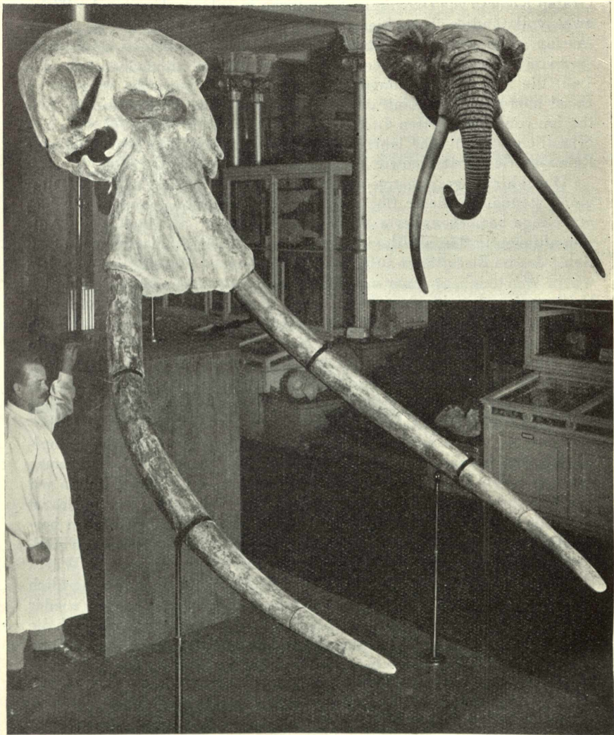
Schädel eines Waldelefanten des Eiszeitalters ( Elephas antiquus FALC.). Aus zwei Funden von Steinheim a. d. Murr zusammengestellt und ergänzt. Länge 4 m. Rechts oben Plastik des Waldelefantenkopfes, in \frac{1}{5} nat. Größe modelliert von Oberpräparator MAX BÖCK.