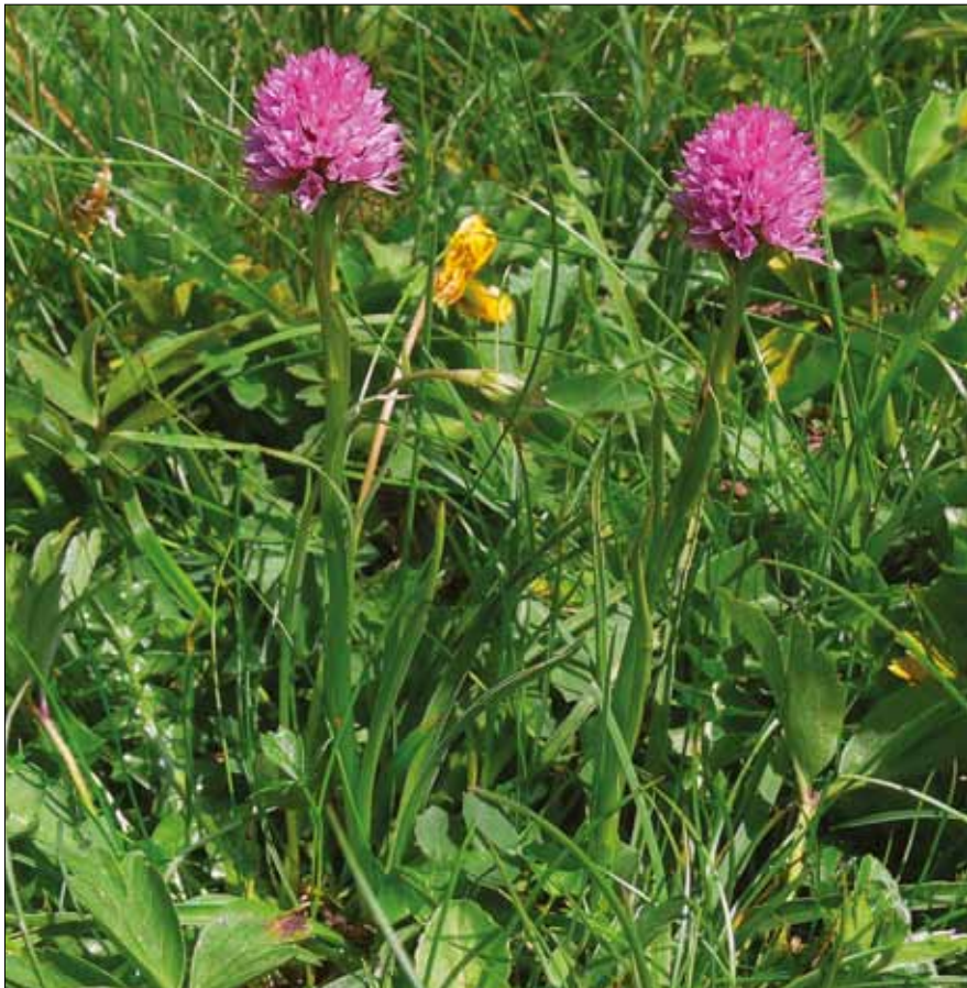
Abb. 5: Nigritella archiducis-joannis , Hochobir (Karawanken); 6. Juli 2006, Foto: Helmuth Zelesny.