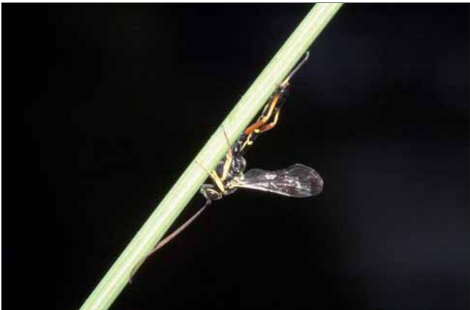
Abb.°9: Syzeuctus fuscator ♂ ruhend an Avena barbata .