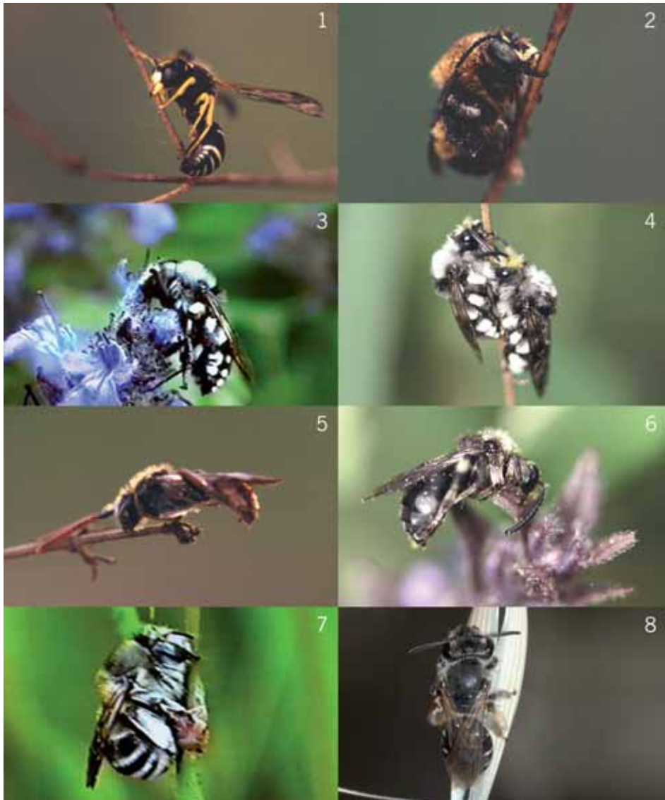
Abb. 7: 1: Odynerus melanocephalus ♂ an Hypericum sp.; 2: Anthophora dalmatica ♂ an Sonchus asper ; 3: Melecta duodecimmaculata ♂ an Ajuga genevensis ; 4: Melecta leucorhyncha ♂ (oben) u. M. albifrons FORSTER ♂ (unten) an Hypericum sp.; 5: Nomada femoralis ♂ an Satureja montana ; 6: Melecta albifrons FORSTER ♂ an Ajuga genevensis ; 7: Anthophora dalmatica ♀ an Sonchus asper ; 8: Andrena ovatula ♀ an Avena sp.