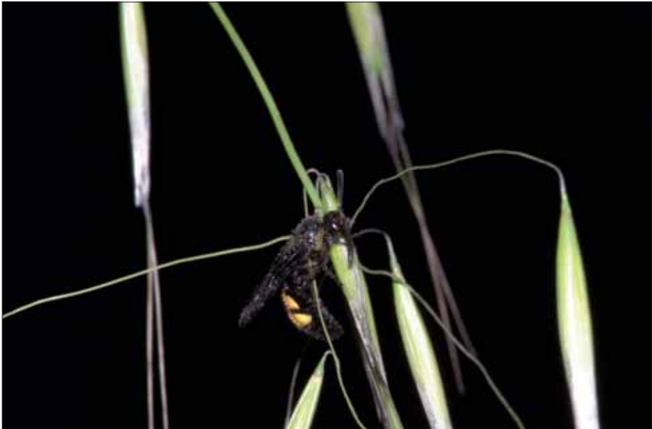
Abb.°8: Scolia hirta ♂ ruhend an Avena barbata .