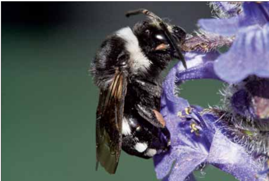
Abb.°6 : Eupavlovskia obscura ♀ ruhend an Ajuga genevensis .