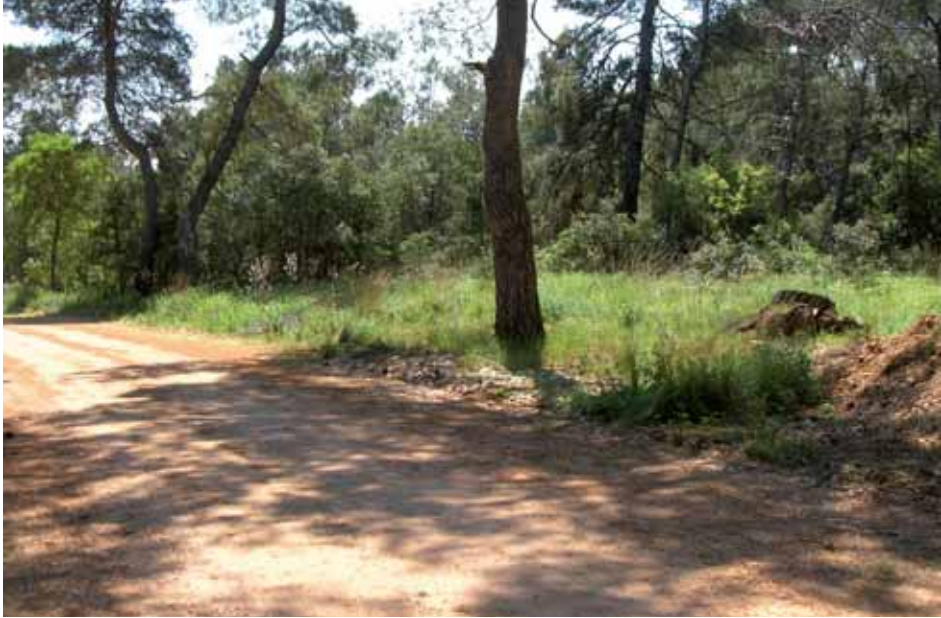
Abb.°1: Nachtruheplatz Waldlichtung am Straßenrand.