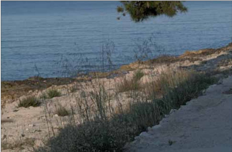
Abb. 3: Avena barbata -Bestand, Nachtruheplatz an der Meeresküste.