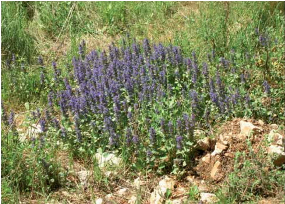
Abb.°2: Ajuga genevensis -Bestand im Bereich der Waldlichtung.