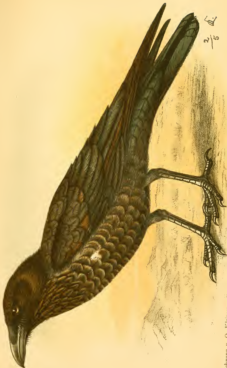
Steinzeichnung v. O. Kleinschmitt