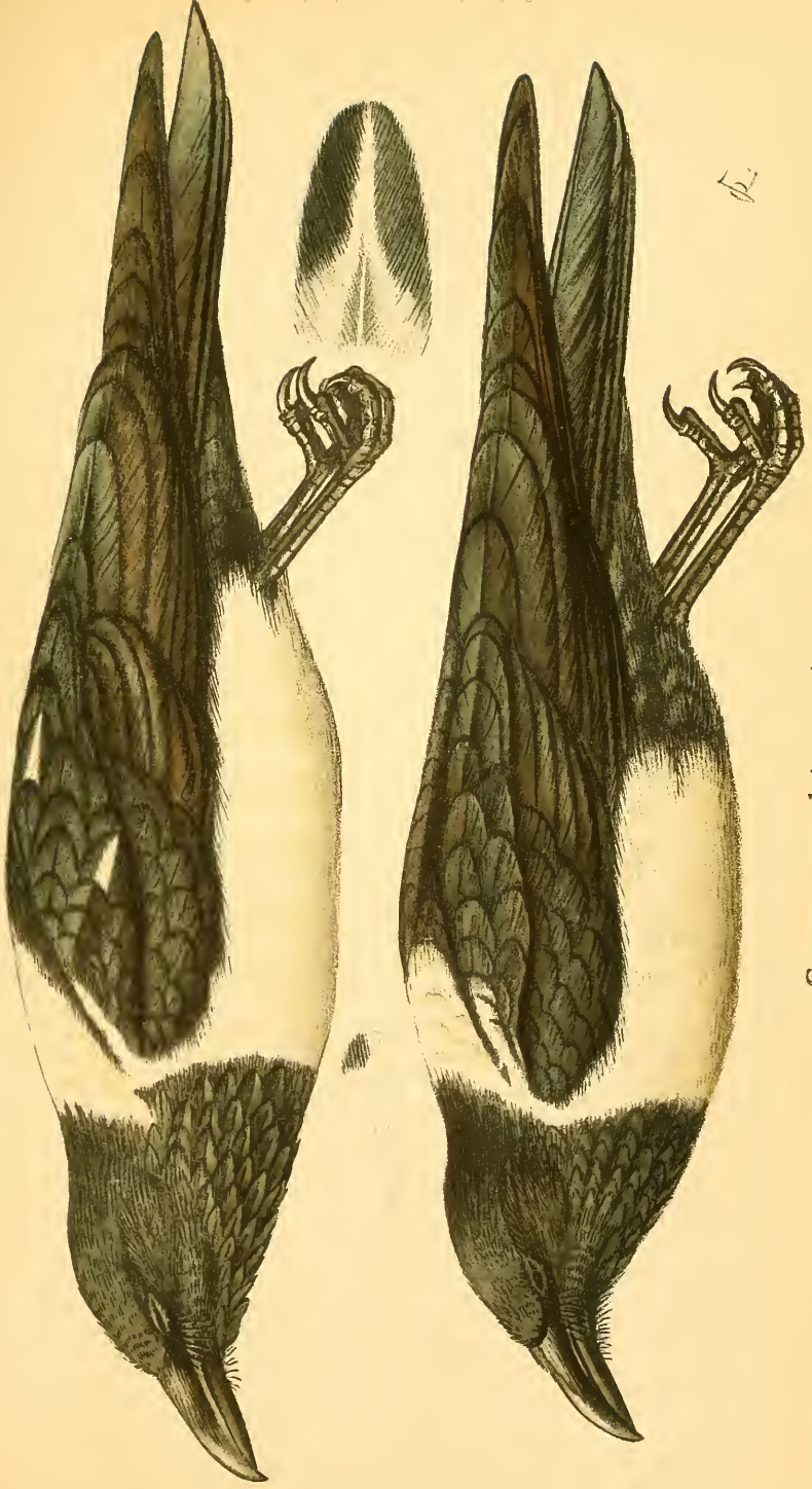
Corvus scapulatus auct.