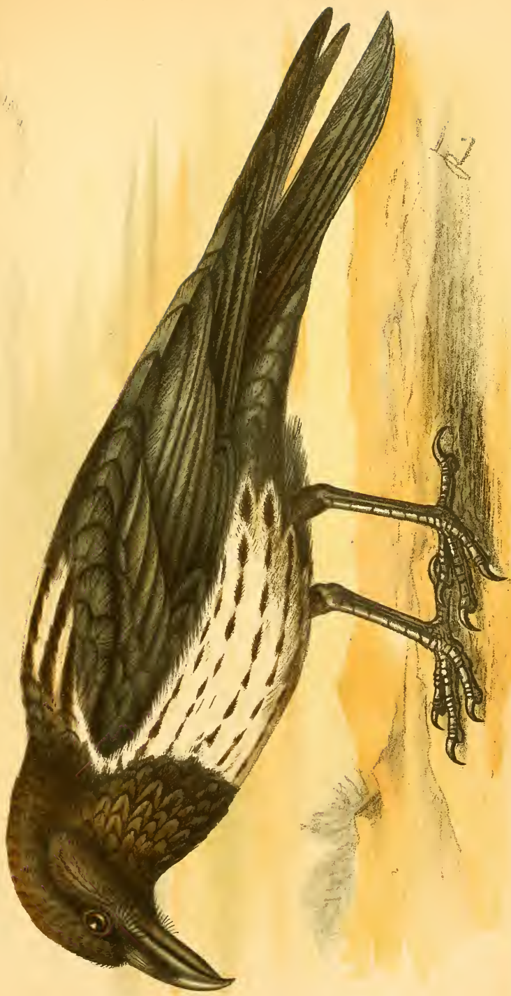
Steinzeichnung v. O. Kleinschmidt.