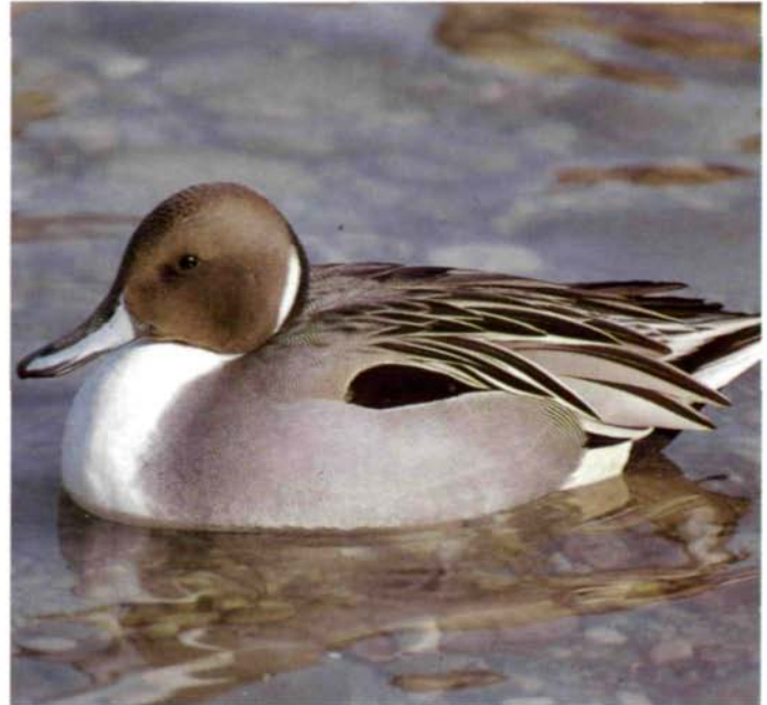
Abb. 30: Spießentenerpel