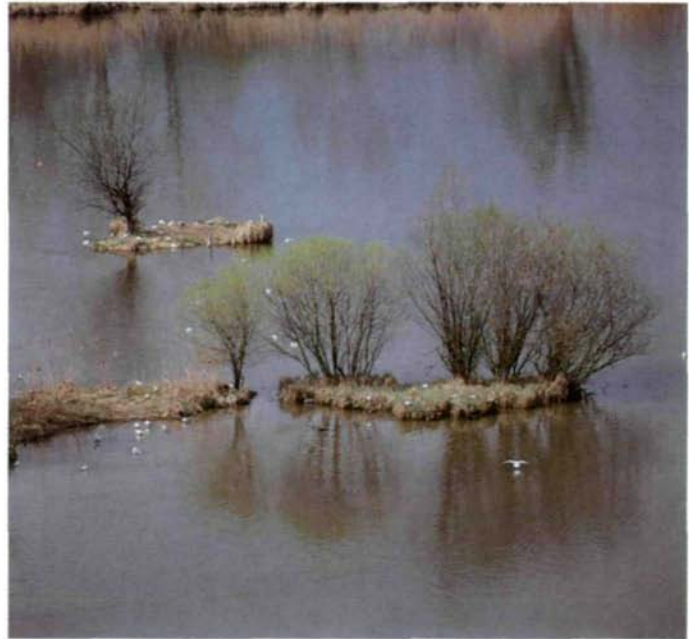
Abb. 27: Lachmöwenkolonie in der Reichersberger Au (Innstausee Egglfing-Obernberg)

Der Stausee Braunau-Simbach an der Salzachmündung wurde 1954 eingestaut, die angrenzenden Stauseen Frauenstein-Ering und Obernberg-Egglfing 1942/43, Schärding-Neuhaus entstand erst 1961.