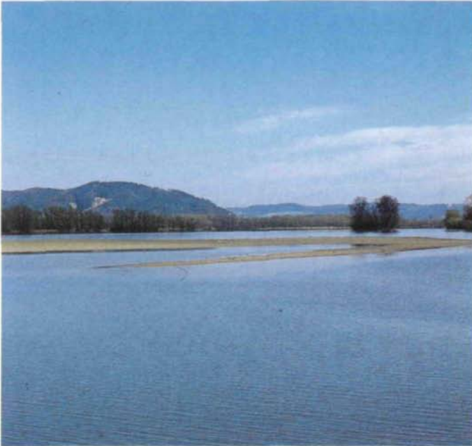
Abb. 29: Hagenauer Bucht des Innstausees Braunau