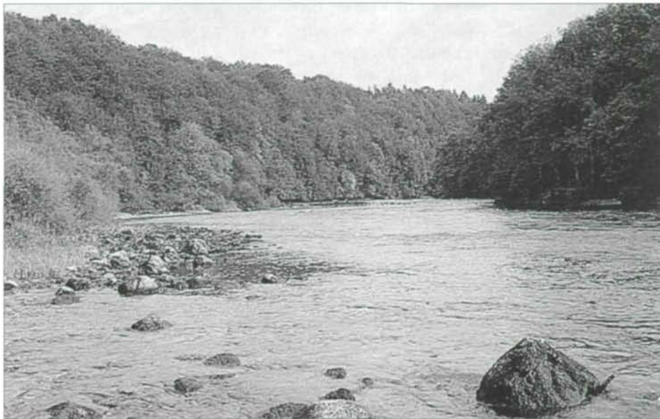
Abb. 6: An der Traun nördlich von Oberweis. Die Fließstrecke der Traun bildet mit den naturnahen von Seggen-Buchenwäldern beherrschten Vegetationskomplexen der Traunleiten ein Biotopensemble von aus der Sicht von Naturschutz und Landschaftspflege überregionaler Bedeutung.

topflächen trockener und feuchter bis nasser Standorte und die Störungseinflüsse in den verbliebenen Restflächen haben im Gemeindegebiet zu einem tiefgreifenden Florenwandel geführt. Die Veränderungen reichen von der Verminderung der Anzahl der Vorkommen und der Bestandsgrößen bis zum Erlöschen einzelner Arten.