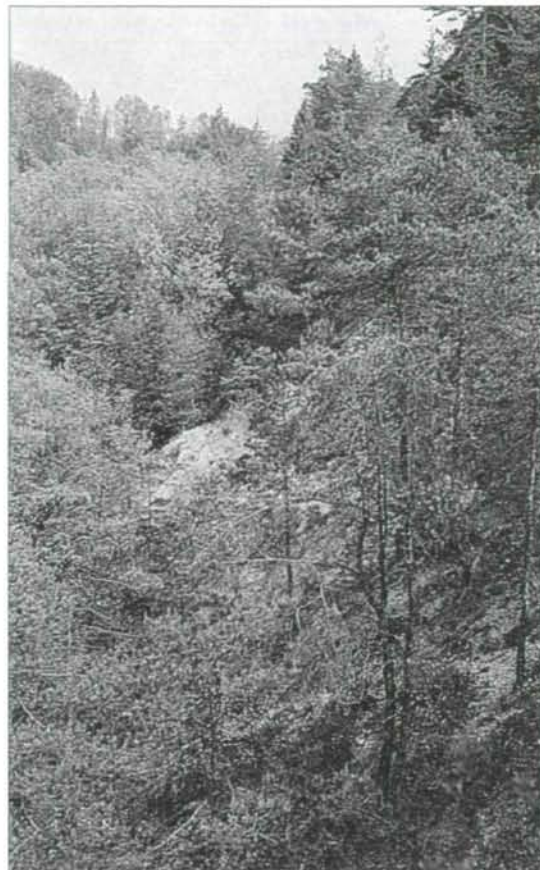
Abb. 3: Im Schutthang der „Schütt“: kleinräumiges Vegetationsmosaik aus Schuttfluren und jüngeren Schneeheide-Kiefernwaldfragmenten. An diesem Sonderstandort kommen einige im oberösterreichischen Alpenvorland äußerst seltene Arten vor (Biotop 4932-17).

genen Günzendmoränen stocken über entkalkten Braunerden einige wenige Bestände bodensaurer Buchenwälder ( Luzulo-Fagetum MEUSEL 1937). Im Unterwuchs dieser artenarmen Hallenbuchenwälder dominieren Säurezeiger, häufig Herden der Schmalblättrigen Hainsimse ( Luzula luzuloides ), anspruchsvolle Arten fehlen gänzlich. In vernäbten Geländemulden und sickerfeuchten Partien entlang der Bachläufe finden sich einige wenige Schwarzerlen-