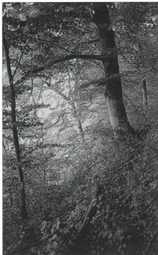
Abb. 2: Ein Teil der sehr naturnahen Buchenwälder der Traunleiten weist infolge der Steilheit des Geländes auch in älteren Stadien noch einen relativ lichten Bestandscharakter auf, weshalb sich zumindest lokal lichtliebende, trockenstolerante Arten im Unterwuchs finden (Biotop 4932-64).

der Lufttemperatur über 8 °C (Station Gmunden [448 m], 1901-1950: 8,3 °C; HYDROGRAPHISCHES ZENTRALBÜRO 1951) kennzeichnet das Arbeitsgebiet. Abgesehen von den Siedlungskernen Laakirchen und Steyrmühl mit ihren großen Industrie- und Gewerbebetrieben weist das Arbeitsgebiet den für weite Teile des alpennahen Alpenvorlandes typischen Landschaftscharakter auf. Mehr als drei Viertel des Gemeindegebietes werden landwirtschaftlich