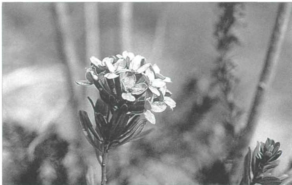
Abb. 4: Der einzige bislang bekannte Fundort des Flaumigen Steinrösels ( Daphne cneorum ) im oberösterreichischen Alpenvorland findet sich in felsdurchsetzten Partien der Traunleiten. Wegen der geringen Bestandsgröße ist die Art als hochgradig gefährdet einzustufen.

Selten in wärmeliebenden Gebüsch und in lichten Mantelbiotopen von Seggen-Buchenwäldern, in von Konglomeratfels durchsetzten Partien der Traunleiten von Laakirchen bis zur nördlichen Gemeindegrenze. Etwas häufiger als Amelanchier ovalis . 8048/2. GASSER (1893): Unterhalb Theresienthal an der Traun.