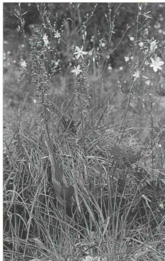
Abb. 5: Die kleinflächigen, von Rasenfragmenten durchsetzten Konglomeratfelsen von Traunleiten und Bahnleiten beherbergen eine große Zahl gefährdeter Gefäßpflanzen, wie die Braunrote Stendelwurz ( Epipactis atrorubens ) oder die Hirschwurz ( Peucedanum cervaria ), deren Grundblätter im Bild rechts zu erkennen sind; im Hintergrund die anmutigen Blütenstände der Ästigen Graslilie ( Anthericum ramosum ) (Biotop 4932-76).

heide-Kiefernwäldern felsdurchsetzter Bereiche der Traunleiten. 7948/4; 8048/2.