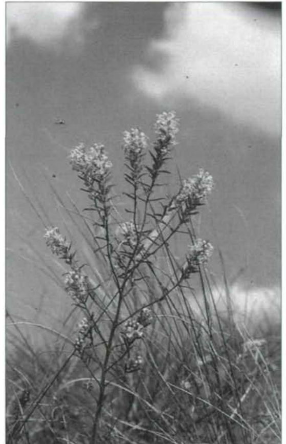
Abb. 3: Odontites lutea = Gelber Zahntrost Letzter belegter Fund auf der Welser Heide: Trockene Hügel an der Landstraße zwischen Wels und Marchtrenk, grasige Hügel, 5.9.1887, M. HASELBERGER (LI). 1898 wurde die Art noch beim Steinbruch in Plesching gesammelt, seither keine Meldung mehr. In Oberösterreich ausgestorben!

Seltenere Arten, wie z. B. der Gelbe Zahntrost ( Odontites lutea ) (Abb. 3), die ganz spezielle offene Magerrasen besiedelten, haben in der letzten Hälfte des vergangenen Jahrhunderts schon ihren Lebensraum eingebüßt und sind in Oberösterreich ausgestorben. Der Vermerk „Welserheide, Sept. 1858, der Standort durch die Westbahnbauten 1859 zerstört“ (LI) auf einem Herbarbeleg von Friedrich v. HARTMANN (*1.2.1840, Linz, †24.6.1866, Custozza) ist für seine Zeit bemerkenswert. Der all-