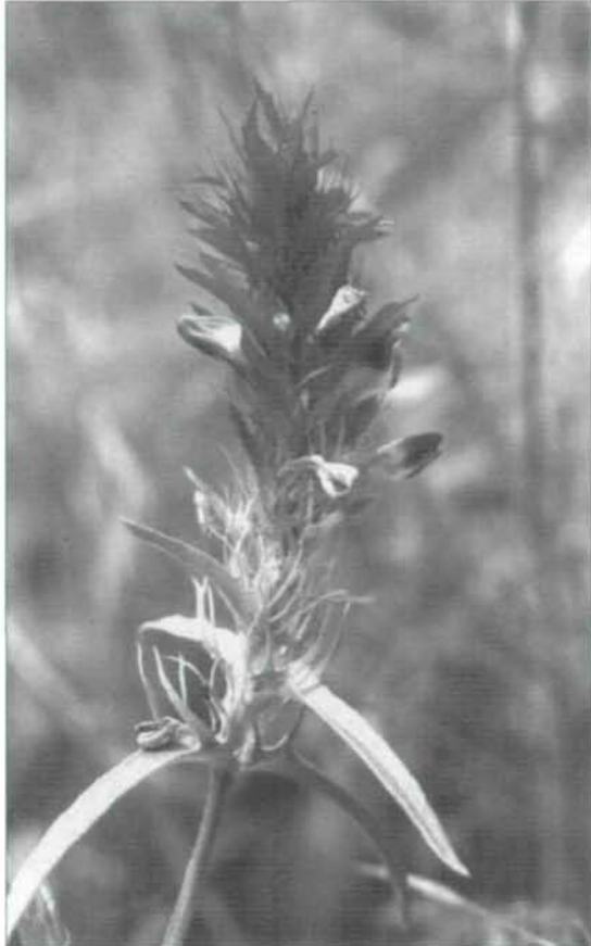
Abb. 4: Melampyrum arvense L. = Ackerwachtelweizen Einst ein Ackerunkraut der Welser Heide, heute in Ober- österreich ausgestorben!