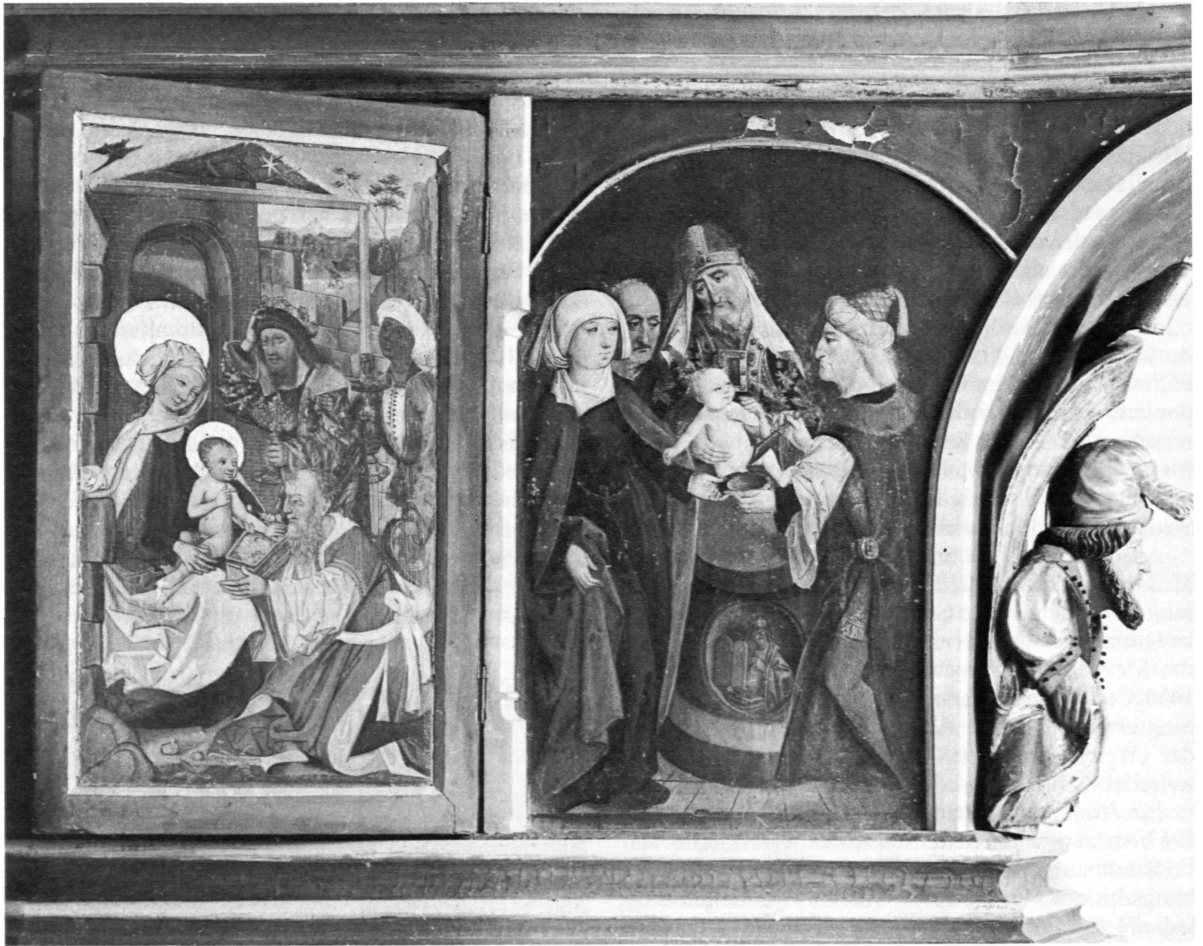
Darbringung und Beschneidung. Tafelbilder aus der Leonhardskirche in Pesenbach, Predella des Hochaltars