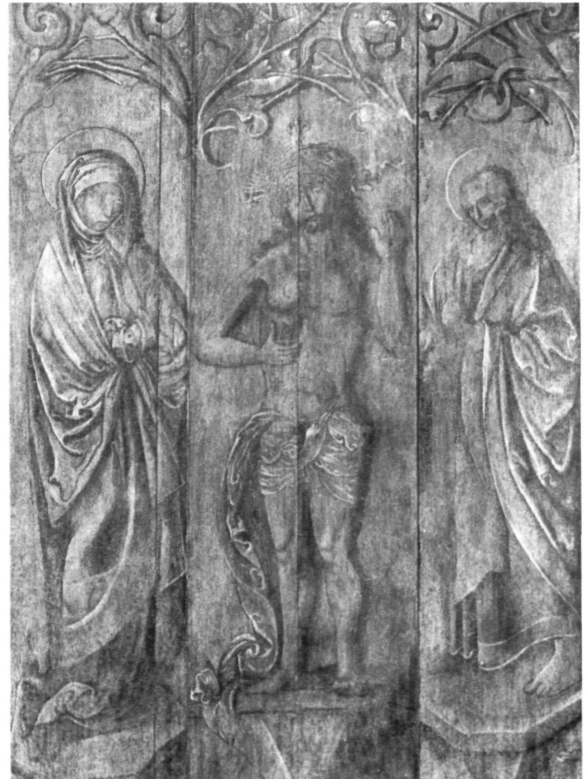
Schreintrückseite eines Altares aus Pabneukirchen Aufn. Mayr

Diese Vielzahl von unterschiedlichsten Stilelementen in den erhaltenen Mühlviertler Glas- und Tafelbildern zeichnet auch die Wandgemälde der Zeit um 1500 aus. Die Fresken in der Pfarrkirche von Bad Kreuzen, die Wandbilder an den Fassaden der Kirchen von Gutau und Pierbach entstammen zwar ungefähr derselben Zeit, gestatten jedoch in keiner Weise den Schluß auf eine einheitliche bodenständige Malerschule.