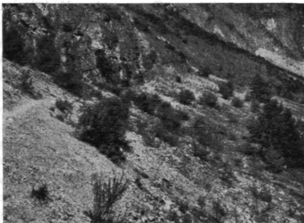
Abb. 3. — Detailbild aus Abbildung 2. Vegetation der Halden.

sehr interessante Fauna, die hauptsächlich aus wärmeliebenden Arten südlicher Herkunft besteht. Schon am Wege springen und fliegen zahlreiche Exemplare von Oedipoda germanica , deren auffallende Färbung mit dem hellen Untergrund lebhaft kontrastiert. An den wenigstens etwas bewachsenen Stellen kommen noch Platycleis grisea , Stauroderus , Oedipoda coerulescens , Podisma pedestris und Calliptamus italicus dazu. Ausgesprochene Gebüschbewohner sind Antaxius pedestris und Barbitistes serricauda , doch ist auch Podisma pedestris hier nochmals zu erwähnen. Das ganze Gebiet dieser eigenartigen Orthopterenfauna ist räumlich sehr begrenzt,