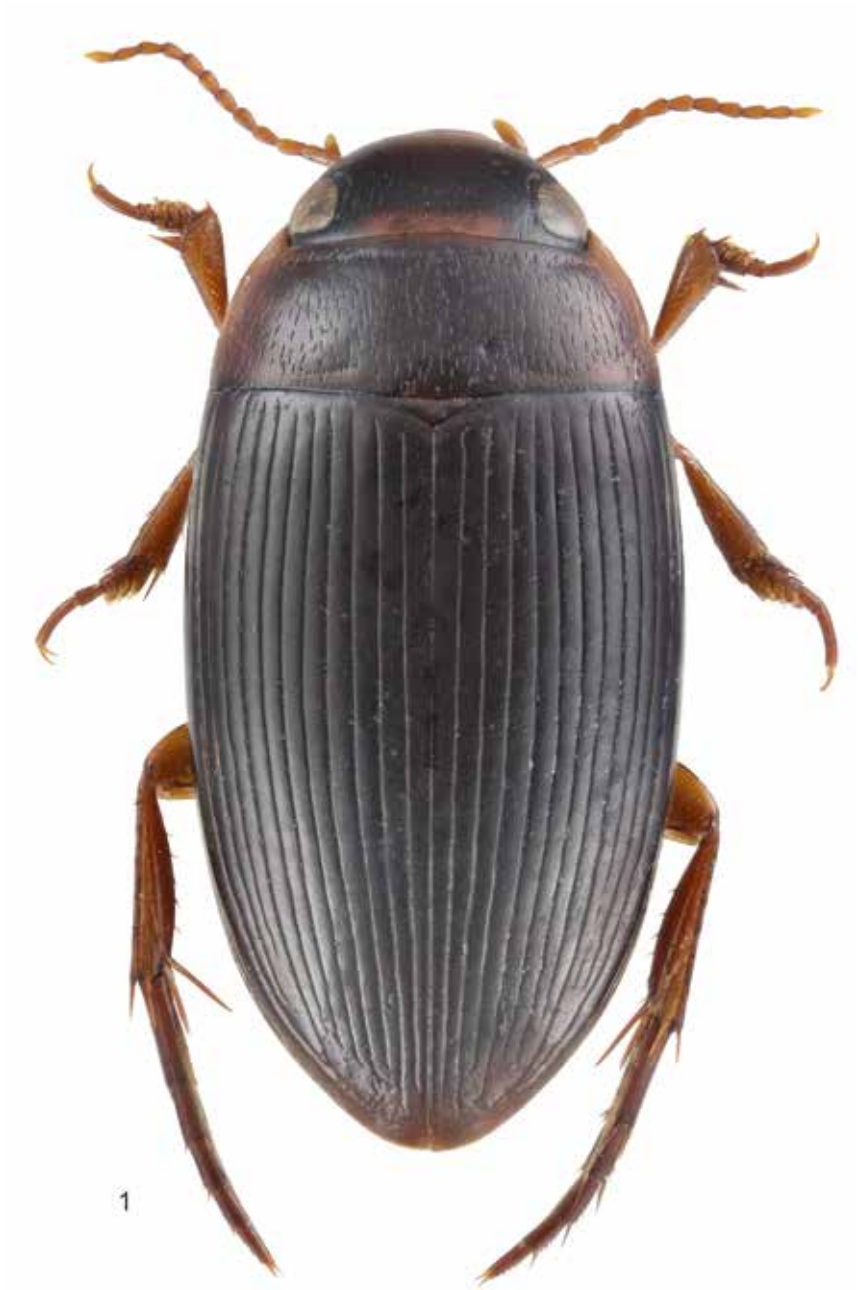
Fig. 1: Copelatus davidi , holotype.