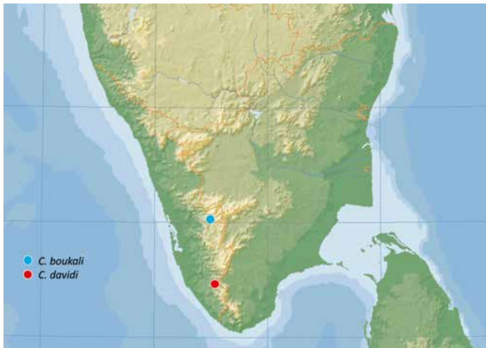
Fig. 3: Geographical distribution of Copelatus boukali and C. davidi .