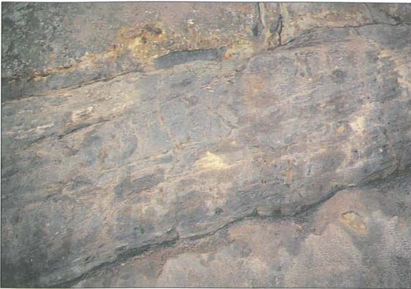
Abb. 4: Bei Laas am Gailbergsattel finden sich in einer bis etwa 30 m mächtigen Serie von grünlich-grauen Quarz-Sandsteinen aus der Permo-Skyth-Zeit mehrere große versteinerte Baumstämme von Cordaiten (nacktsamige Blütenpflanzen). Es sind nicht nur die Funde von Pflanzenresten in diesen Schichten an sich eine große Seltenheit, sondern sie sind vor allem durch ihre Größe in den Alpen etwas Einmaliges.

(dafür wären wohl auch künstliche Aufschlüsse sowie Materialuntersuchungen im Labor notwendig). In der Gemeinde St. Margareten i. Rosental liegt am „Boden“ auf der Matzen der berühmte „Eiskeller“ (Abb. 6), eines der wenigen echten, weil ganzjährigen Eislöcher in Österreich. Am Ausgang des Bärenales bei Feistritz i. Rosental zeigen steil schräg gestellte Schichten des jungtertiären Bärenalkonglomerates die bis in die jüngste Zeit andauernde Nordbewegung der Karawankenberge an. In der Ebriachklamm westlich von Eisenkappel sind vor allem auf der orographisch linken Talseite beim dortigen Steinbruch zahlreiche „Pillows“ (= Kissenlaven) eines altpaläozoischen, untermeerischen Lavaausstrittes zu sehen (Abb. 7).