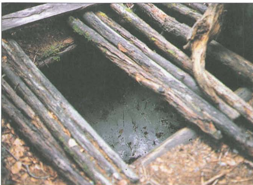
Abb. 6: Der Eiskeller am Boden unterhalb der Matzen hat sich infolge spezieller, lokaler bodenklimatischer Verhältnisse in den hier vorhandenen mächtigen Schutt- und Blockhalden entwickelt. Das hier selbst in der heißen Jahreszeit vorhandene Bodeneis kühlt die überlagernden Schichten zum Teil so stark ab, daß sich örtlich eine tundrenartige Kümmervegetation entwickelt hat. Ein vor mehreren Jahrzehnten bei der Wassersuche gegrabener Brunnenschacht füllte sich zur unliebsamen Überraschung nicht mit Wasser, sondern binnen weniger Monate fast völlig mit Eis. Derartige, wirklich ganzjährige Bodeneisbildungen gibt es in den Alpen zwar mehrfach, aber insgesamt sehr, sehr selten.

Silberekalm. Eine hydrologische Besonderheit stellen die im Sommer wie Winter wasserreichen Tielquellen bei Himmelberg dar: sie sind versickerndes Wasser des Gurkflusses, das durch und unter den quartären Ablagerungen der Präkowahöhe hindurch zum Himmelberger Graben hin seinen Weg nimmt. Auf die alte, nur wenig akzentuierte Landoberfläche aus der Tertiärzeit weisen auf den Nockbergen nicht nur die zahlreichen Altflächenreste in verschiedenen Höhenlagen hin, sondern auch ein Vorkommen von Braunkohle in grauen Tönen im Laußnitzgraben östlich des Katschberges in etwa 1650 m Seehöhe – das war in der alten Landschaft eine versumpfte Mulde, in der sich Holzreste sammelten. Kalkreiche Quellen haben nicht nur am Lappenbach (siehe oben), sondern auch bei Lippitz-