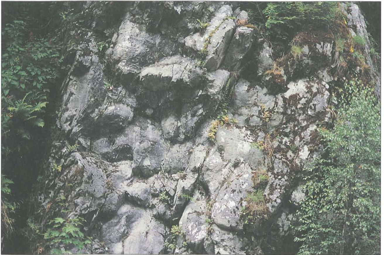
Abb. 7: Kissen- oder Pillowlava aus dem Ordovizium (älteres Erdaltertum, ca. 500 Mio. Jahre) in der Ebriachschlucht bei Eisenkappel. Beim Austritt von basischer (kieselsäurearmer) Lava aus Spalten am Meeresgrund bildet diese oft kugelige oder wulstige Strukturen („Tropfen“), die z. B. beim großen Steinbruch in dieser Schlucht als bis gegen 1 m große „Kissen“ in großer Zahl zu sehen sind.

von geologischen Lehrpfaden, Schauhöhlen, Schaubergwerken und Bergbaulehrpfaden sowie Geoparks in Nordrhein-Westfalen sowie in den unmittelbar benachbarten Niederlanden kurz vorgestellt; zu vielen dieser Geoschauen gibt es Broschüren und Führer. Eine gewisse Initiative zur Einrichtung weiterer Geopfade gibt es seit relativ kurzer Zeit auch in und aus Kärnten: