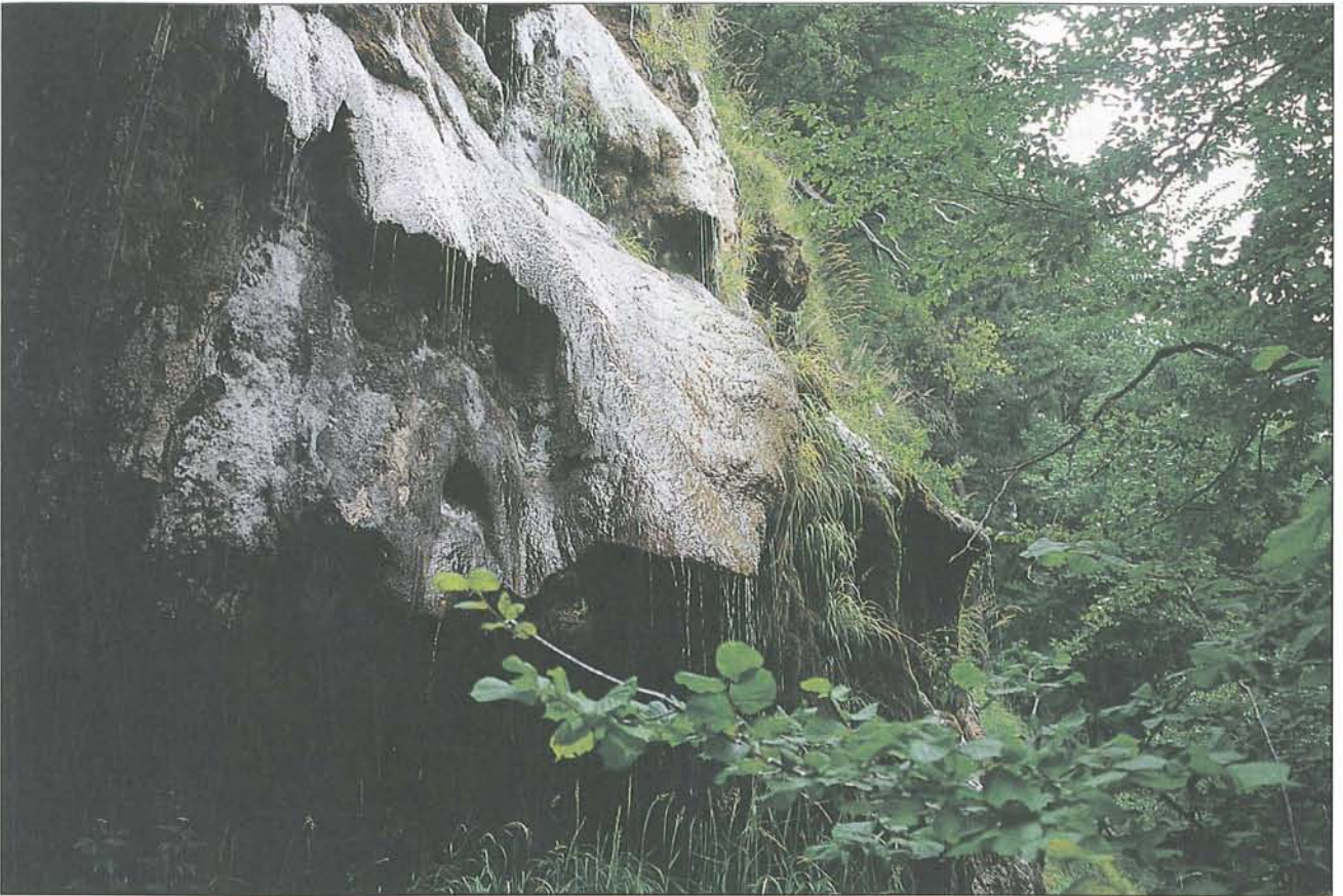
Abb. 3: Die umfangreichste pleistozäne Schichtfolge Kärntens findet sich in der Köttmannsdorfer/Maria Rainer Senke. Bei Maria Rain bildet die Hollenburger Nagelfluh (wahrscheinlich aus der Mindel-Riß-Zwischeneiszeit) eine Steilstufe, unterhalb welcher die Mindel-Grundmoräne liegt. Die überlagernde Riß-Moräne staut das aus den interglazialen „Köttmannsdorfer Schottern“ stammende Wasser, das beständig als „Ewiger Regen“ über die Steilstufe rinnt und tropft.