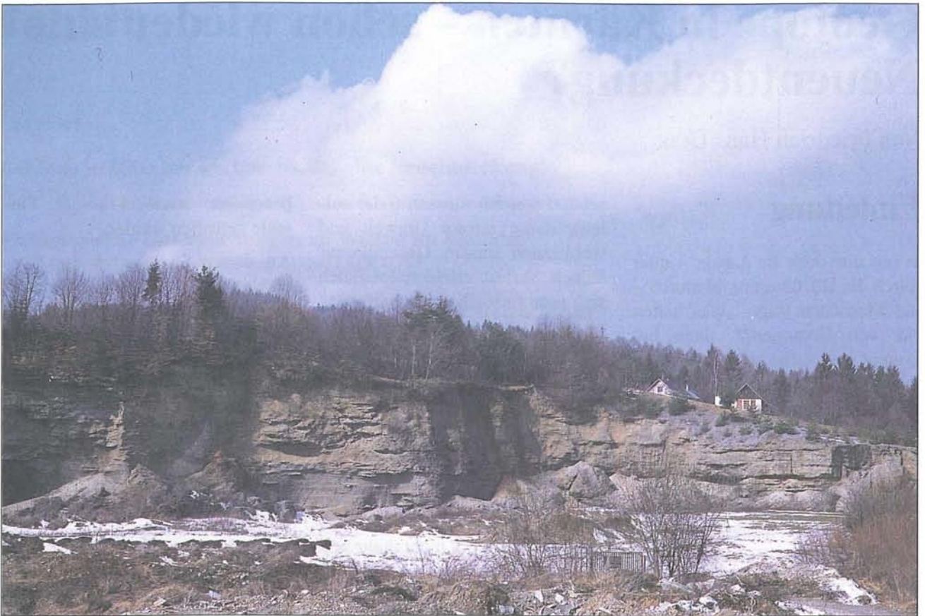
Abb. 1: Nur infolge eines jahrelangen Abbaues in einer Kiesgrube bei Köttmannsdorf können hier die teilweise verkitteten Köttmannsdorfer Schotter aus dem Riß-Würm-Interglazial in vorzüglichen Aufschlüssen besichtigt werden.