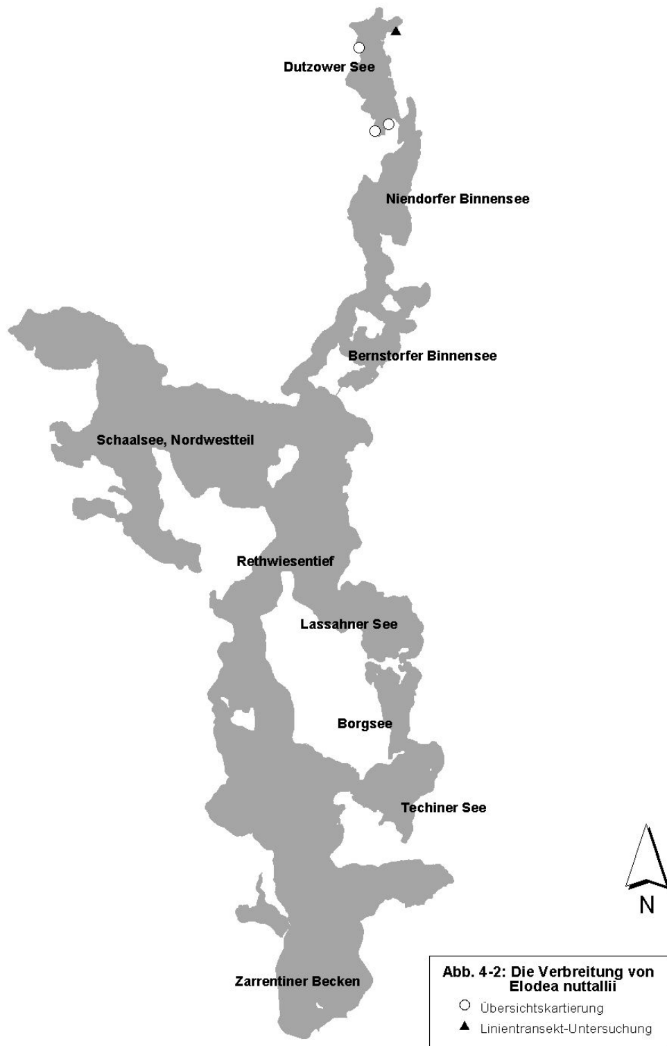
Abb. 2: Die Verbreitung von Elodea nuttallii im Schaalsee und seinen Nebengewässern