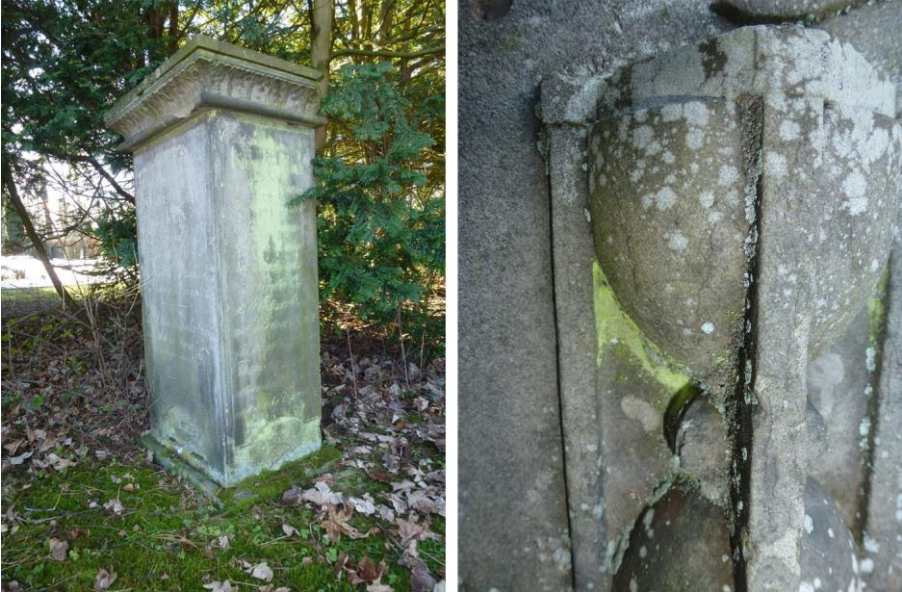
Abb. 2: Gelbfrüchtige Schwefelflechte ( Psilolechia lucida ) auf historischen Sandstein-Grabmälern auf dem Eichhoffriedhof in Kronshagen bei Kiel: Grüngelblicher, flächiger Überzug an der Nordseite eines Grabmals (links) und Regen geschützte Nischenbesiedlung in einem Grabsteinornament (Sanduhr)

Die großen Verbreitungslücken im südlichen Schleswig-Holstein spiegeln teilweise auch Kartierungslücken wieder. Daher soll die Verbreitungskarte in Abbildung 1 gleichzeitig dazu anregen, bestehende Kartierungslücken zu schließen und Funde dieser auffälligen Flechte zu melden. Die Frage lautet daher: Wo steckt »Luci« ( Psilolechia lucida )? Alle naturkundlich Interessierte sind aufgerufen, Fundorte der Schwefelflechte »Luci« in Schleswig-Holstein zu melden.