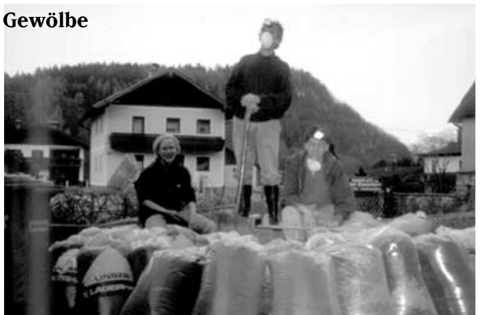
Die Jahrzehnte alten Spuren einer Wochenstube ...

Anfangs waren wir noch ratlos, was mit dieser ungeheuren Menge Guano machen sollten. Doch bald machte sich im ganzen Ort das (wahre)