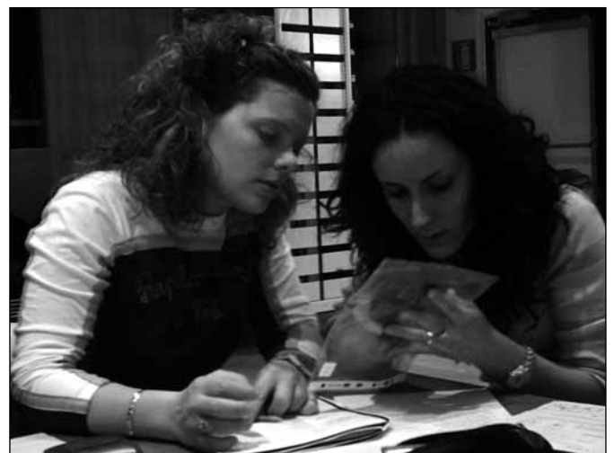
Grenzüberschreitende Bestimmungsarbeit in Südtirol

Im Rahmen eines Studenten-Forschungscamps in Lovrenc na Pohorju (Slowenien) wurde eine Fledermaus-Forschungs-Gruppe gegründet. Die Themen im Camp umfassten die Bestimmung von lebenden Fledermäusen und Präparaten (vor allem Skelette, Schädel), die Arbeit mit Mischer- und Zeitdehnungs-Ultraschalldetektoren inklusive der Auswertung der aufgezeichneten Fledermausrufe, Quartierkontrollen, Netzfänge. Zudem wurde auch Basiswissen über GIS, d.h. Geografische Informationssysteme, vermittelt.