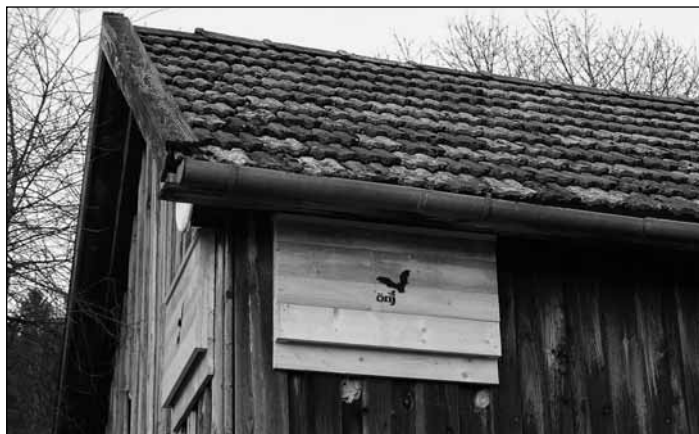
Die Kästen sind groß und lassen sich gut kontrollieren