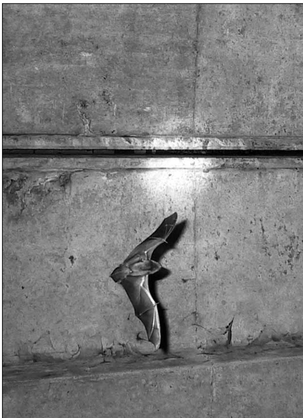
Quartier von Großen Abendseglern in der Dehnungsfuge einer Autobahnbrücke

Weibchen bei den Männchen. Die Balzrufe sind zum Teil so laut und niedrigfrequent, dass sie sogar für uns Menschen als lautes Zetern und Trillern hörbar sind. Achten Sie im Herbst einmal darauf, wenn Sie durch einen Wald mit Altholzbeständen oder auch alte Alleen gehen!