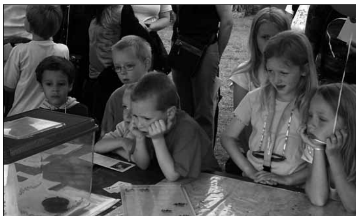
Kinder beobachten interessiert die Fledermäuse

heim beherbergen oder Voraussetzungen schaffen wollen, damit sich die Tiere ansiedeln können. Durch die Publikationen wurden auch heuer wieder neue Quartiere bekannt, wie zum Beispiel ca. 10 Spaltenquartiere der Zwerg-