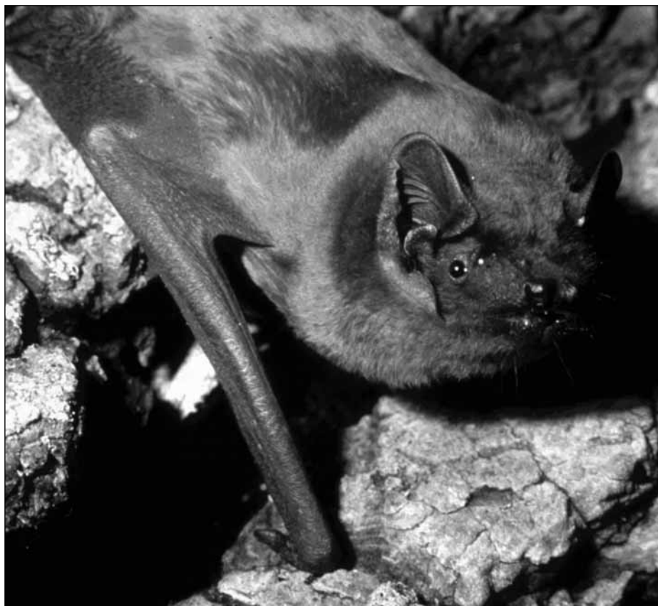
Der Große Abendsegler fällt im Herbst oft auf, wenn er bereits am Nachmittag auf Insektenjagd geht