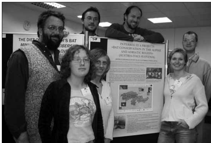
Gemeinsames Arbeiten für den Fledermausschutz im Alpen- und Adriaraum