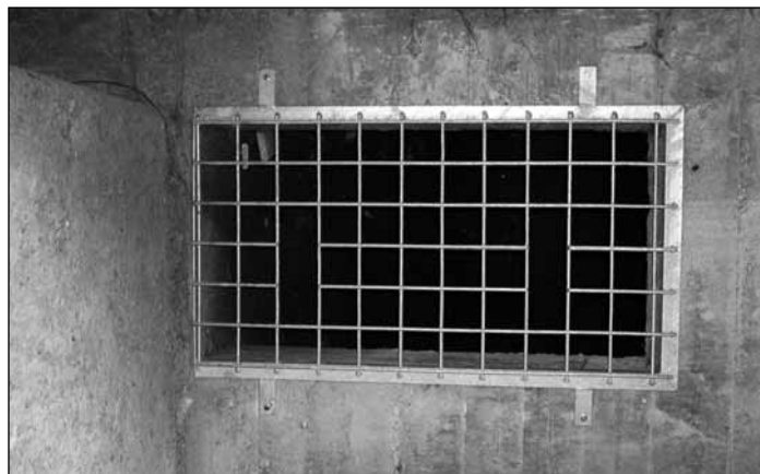
Vergitterung in der Lingenauer Hochbrücke

Rohrbach an Stadeln, Holzhöfen, Vieh- unterständen, Garagen etc. ein bis neun (durchschnittlich 3,6) Kästen montiert.