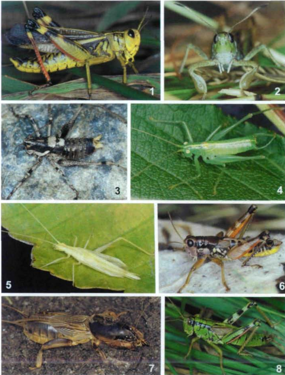
Abb. 1-8: Arcyptera fusca (PALLAS), ♂ (1), N-Tirol, Pfunds, 13. Sept. 1999. – Gomphocerus sibiricus (L.), ♂ (2), N-Tirol, Innsbruck / Patscherkofel, 13. Aug. 2000. – Antaxius pedestris (F.), ♂ (3), N-Tirol, Ötztal / Brunau, 25. Juli 1993. – Meconema meridionale A. COSTA, ♂ (4), N-Tirol, Innsbruck / Hötting, 24. Aug. 1992. – Oecanthus pellucens (SCOPOLI), ♀ (5), Griechenland, Igoumenitsa, 24. Sept. 1997. – Podisma pedestris (L.), ♂ (6), N-Tirol, Obergurgl / Gurgler Heide, 2. Okt. 1999. – Gryllotalpa gryllotalpa (L.), ♀ (7), S-Tirol, Passeiertal, März 1994. – Miramella alpina (KOLLAR), ♀ (8), N-Tirol, Pfunds, 13. Sept. 1999.