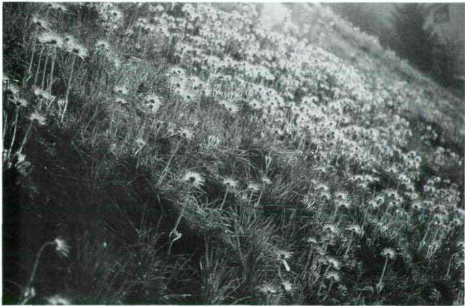
Abb. 2: Ausschnitt aus dem größten Bestand von Pulsatilla vulgaris in Oberösterreich (Fundort Nr. 21) zur Fruchtreife; April 2003.

Fundort 21 (21): S-exponierter Halbtrockenrasen bei Zufahrt zu Häuserreihe am Fuß der Niederterrassenböschung 700 m östlich vom großen Straßenkreuz nahe Sierninghofen/Sierning (7952/1). Etwa 440 blühende Stöcke (1991), nach Wiederaufnahme der Mahd Ende der 1990er Jahre Bestandesanstieg auf 658 blühende Stöcke (2005). Der derzeit individuenreichste Bestand Oberösterreichs (Abb. 2).