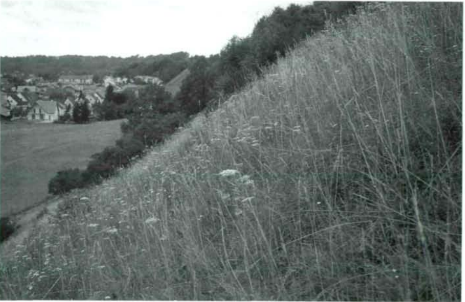
Abb. 4: Die SO-exponierte Terrassenböschung des "Keltenweges" (Fundort Nr. 25) wird seit Beginn der 1990er Jahre nach naturschutzfachlichen Gesichtspunkten gepflegt. Die obere Abbildung zeigt einen Ausschnitt des stark verbrachten Halbtrockenrasens (August 1990), die untere Abbildung zeigt den aktuellen Zustand nach Rodung der Gehölze und Wiederaufnahme der Mahd (August 1999).