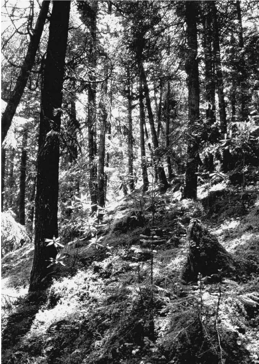
Abb. 3: Nadelwald mit Rhododendron -Unterwuchs bei Dagcanglhamo in der Umgebung des Typenfundortes von Trigonurus ruzickai .