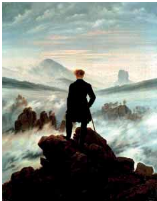
Abbildung 2: Caspar David Friedrich: „Wanderer über dem Nebelmeer“ (1818). Es ist die Sakralität zu sehen, mit der das Subjekt seine Selbstschätzung vornimmt. Gebirgslandschaft ist ein gutes Beispiel für das Erhabene bei Kant und für ein Naturbild des entsexualisierten, reinen Heiligen. ( http://4.bp.blogspot.com )

Es gibt aber auch Vorstellungen von Unerreichbaren, von denen das Sinnliche ganz entfernt wurde und die das Geistig-Sinnhafte symbolisieren. Entsprechende Frauenbilder sind entsexualisierte heroische Jungfrauen, Märtyrerinnen oder die Heilige Maria selbst. Das Subjekt erkennt das Ideal der reinen Geistigkeit im Bild der Unerreichbaren. Die äußere Natur, die diesen Projektionen entspricht, ist vorzugsweise in luftigen Höhen und in trockeneren Klimaten zu finden. Entsprechende Naturbilder sind daher erhaben und von einer unendlichen Weite – zum Beispiel Wüsten und Gebirge. Das Subjekt erhebt sich in solcher, ihn in „überirdischer Weise“ umgebender Natur über jegliche Niederungen oder muss zumindest nicht befürchten, dass seine Grenzen zerfließen, da die Assoziation mit dem tropisch Vegetativen und wuchernder Fruchtbarkeit (wie bei den Wilden, siehe unten) vermieden wird. Erhabene Wüsten und Gebirge können als eher „männlich“ empfunden werden, weil das Subjekt durch ihre quantitative Unbegreiflichkeit auf sich selbst zurückverwiesen wird (vergleiche KANT 1794, §§ 25-27). Dass es die Natur sei, die bei geistig-sinnhaften Naturbildern als männlich wahrgenommen wird, wie anfangs (in der Einleitung) noch intuitiv angenommen, stimmt also nicht. Es ist nicht diese, die als „männlich“ wahrgenommen wird, sondern das Subjekt, das in ihr die erstrebte, aber immer unverwirk-