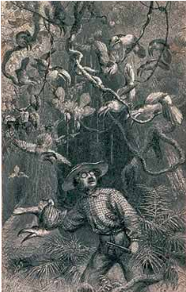
Abbildung 3: Henry W. Bates (1825-92), der Entdecker der Bates'schen Mimikry, auf einer Amazonasexpedition. Über ihm schimpfen Tukane, er wirkt verängstigt angesichts der Wildheit und dem Überfluss des Dschungels. ( http://www.sil.si.edu/exhibitions/voyages/1-19-Bates.jpg )

Wilden müssen für die Unreinheit des Geistes des Subjekts büßen; da sie entsexualisiert sind, können sie rational bekämpft werden, ohne dass das Subjekt durch sexuelle Gelüste abgelenkt würde.