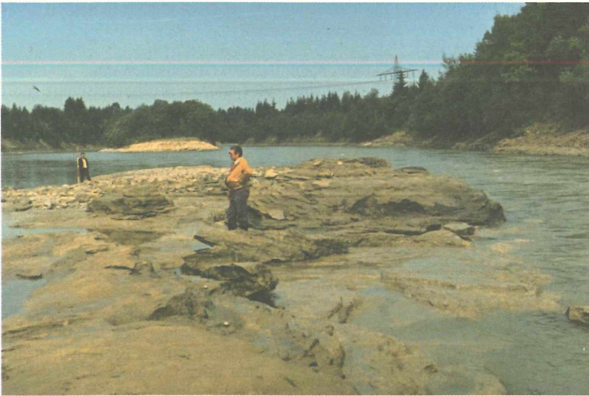
Abbildung 5 Problemfall: sich in erosionsanfällige Schichten eintiefende Fluß- betten (Lech)

Ohne Umweltschutz ist ein Wirtschaftsstandort langfristig nicht haltbar!