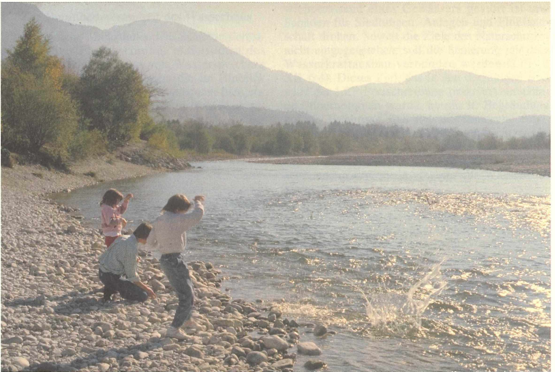
Abbildung 7 Naturerlebnis: Natur "Zum Anfassen" (Lenggries/Isar)