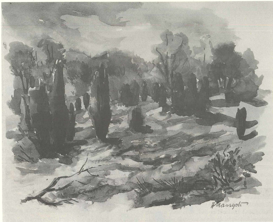
oben: Heinrich W. Mangold Heide bei Wilsede Aquarell 1974