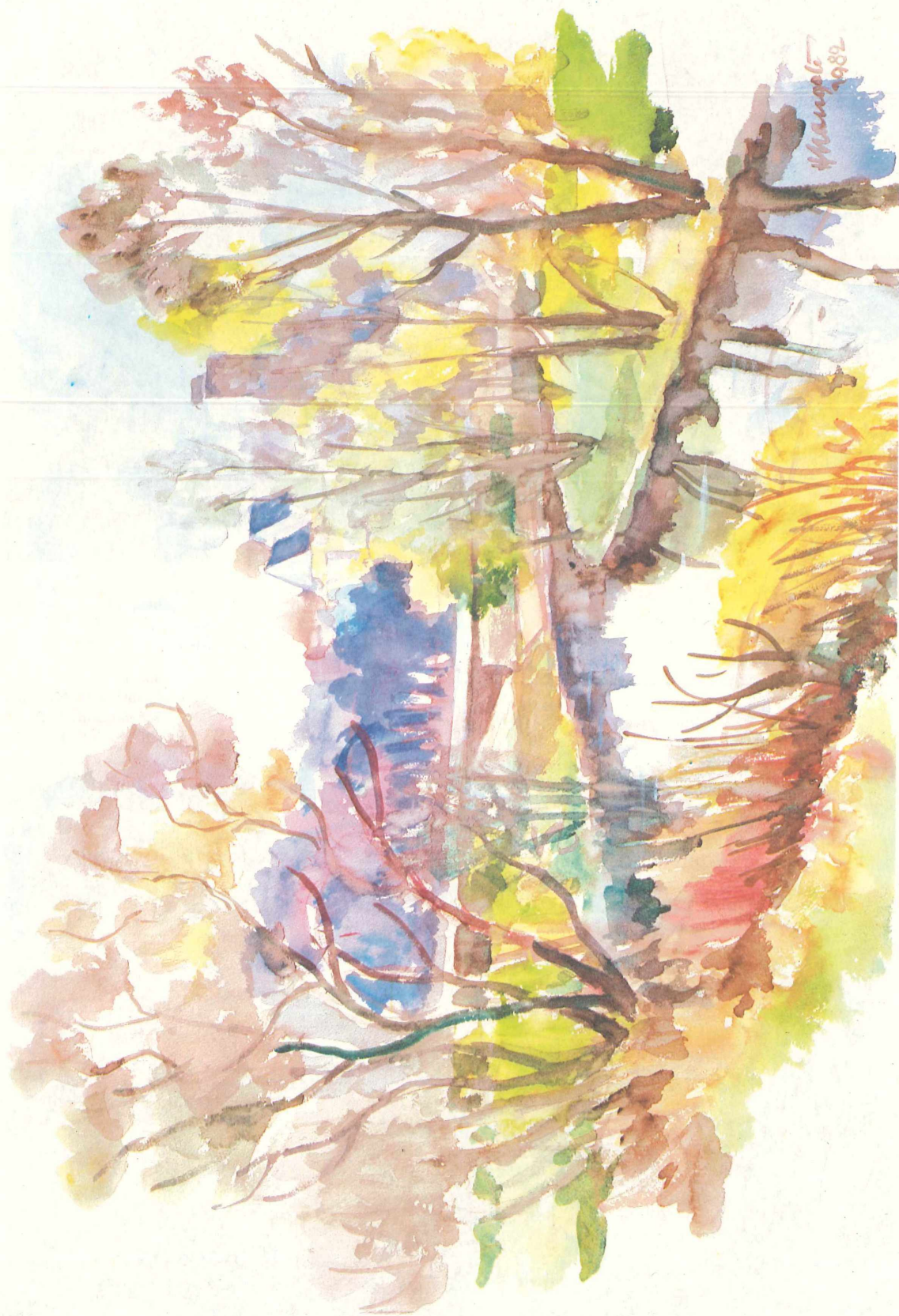
Heinrich W. Mangold Altmühltal bei Pappenheim Aquarell