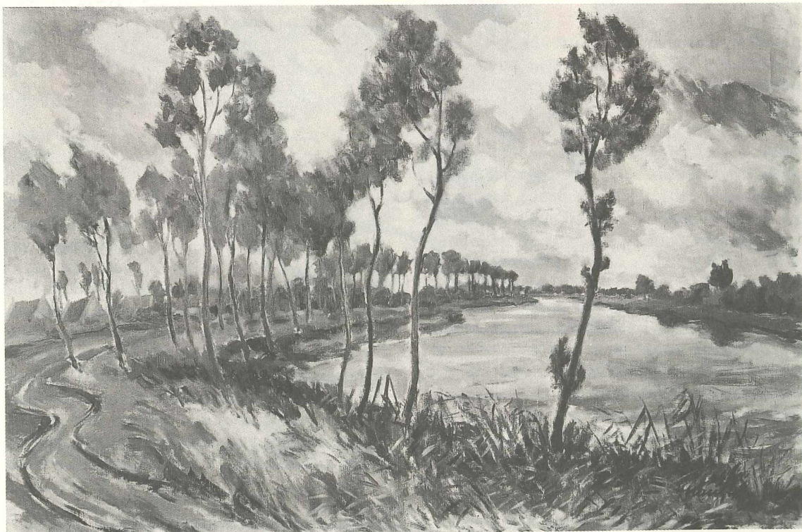
unten: Heinrich W. Mangold Scheldelandschaft Öl; 70 x 100 cm