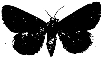
Fig. 1 (oben): Catocala kotshubeji Shel. ♂.