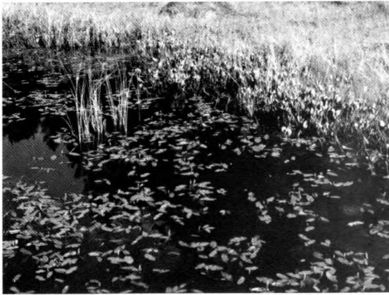
Abb. 2: Torfstich f 1: Torfstich mit großer Population von Leucorrhinia pectoralis . Vegetation: Carex rostrata , Menyanthes trifoliata , u.a. sowie große Bestände von Potamogeton natans und Sparganium minimum . - Peat-digging No. f 1, habitat with large larval population of Leucorrhinia pectoralis . Emerse vegetation mainly consisting of Carex rostrata and Menyanthes trifoliata and submerged vegetation mainly built up by Potamogeton natans and Sparganium minimum .