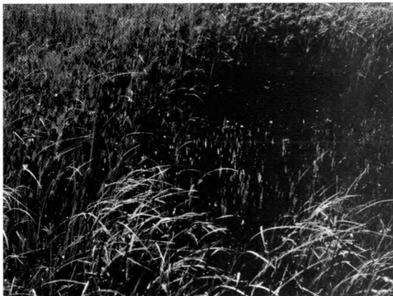
Abb. 3: Torfstich h: Optimalgewässer von Leucorrhinia pectoralis , dessen Wasserfläche die für Larvalhabitate der Art typische Strukturierung durch locker flutende Uferpflanzen, in diesem Fall v.a. Equisetum fluviatile , Menyanthes trifoliata und Carex rostrata , zeigt. - Peat-digging h, showing the typical structure of optimal larval habitats of Leucorrhinia pectoralis with helophytes, such as Equisetum fluviatile , Menyanthes trifoliata and Carex rostrata , growing in low densities at the open water surface.