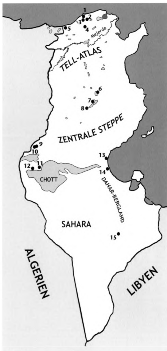
Abb. 1: Karte von Tunesien mit den wichtigsten Landschaftsräumen und den 15 Fundorten von Paragomphus genei . – Fig. 1: Map of Tunisia with the main regions and the 15 record localities of Paragomphus genei .