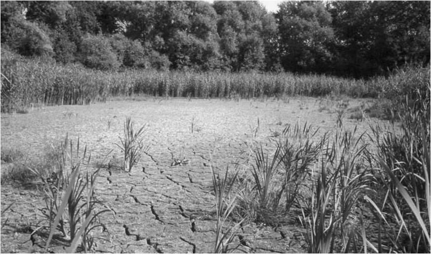
Abbildung 2: Feldsoll bei Brodowin am 16.08.2001. Das gesamte Soll war im Zentrum von Juli bis November 2001 bei minimal gemessenem Wasserstand im August von 52 cm unter Flur vollkommen ausgetrocknet. — Figure 2: Kettle hole near Brodowin, Brandenburg, Germany, 16-VIII-2001. The pond dried up from July to November 2001. In August the water table reached 52 cm under ground.