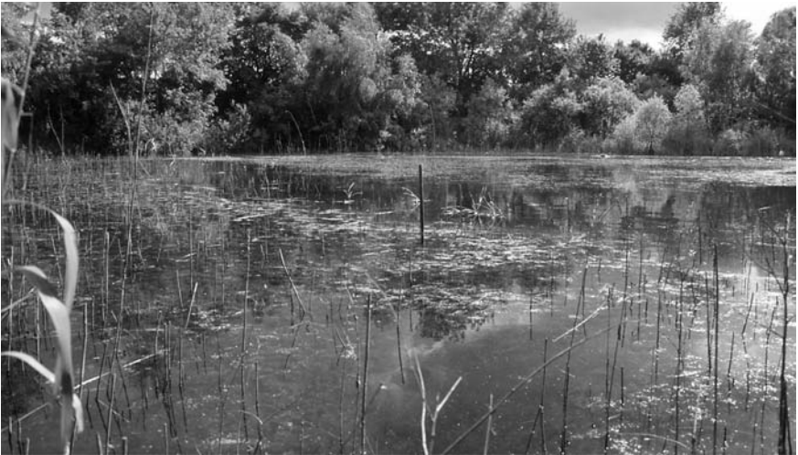
Abbildung 3: Feldsoll bei Brodowin am 28.06.2004. Seit den starken Winterniederschlägen 2001/2002 war das Gewässer wieder permanent wasserführend und stellte mit seinen Vegetationsstrukturen ein geeignetes Eiablagehabitat für Brachytron pratense und Leucorrhinia pectoralis dar. — Figure 3: Kettle hole near Brodowin, Brandenburg, Germany, 28-VI-2004. After heavy rainfall during winter 2001/2002 the pond was perennial and a suitable breeding habitat for Brachytron pratense and Leucorrhinia pectoralis .