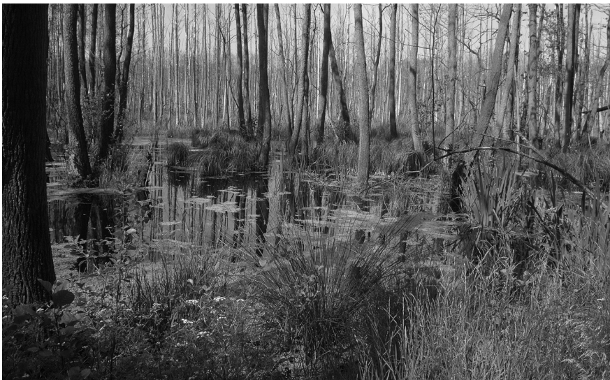
Abbildung 1: Ausschnitt aus dem revitalisierten Waldmoor bei Wöpkendorf, Mecklenburg-Vorpommern, im Juni 2006. — Figure 1: Section of the revitalized forest mire near Wöpkendorf, Mecklenburg-Pomerania, in June 2006.