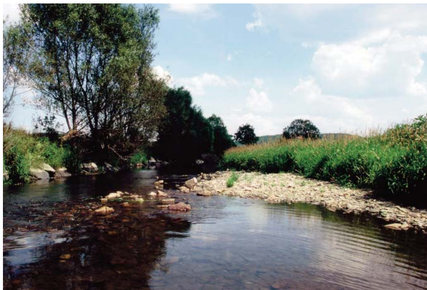
Abbildung 3: Die Lahn in Hessen: Auf den Kiesbänken an der ruhigen Wasserfläche rechts wurden keine Imagines von Onychogomphus forcipatus beobachtet, aber am linken Steilufer wurden Exuvien zwischen der Vegetation gefunden. Fundort Nr. 10 Caldern, Landkreis Marburg-Biedenkopf (13.07.2005). — Figure 3. River Lahn in Hesse, Germany: No adult Onychogomphus forcipatus were observed at the gravel bank with calm water in the foreground, but exuvia were collected from the steep bank in the left background (13-vii-2005).