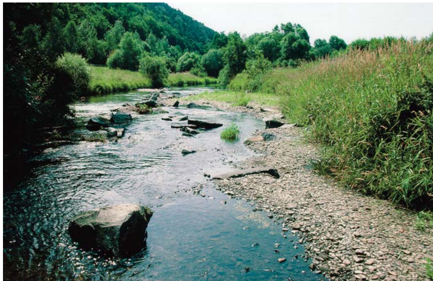
Abbildung 2: Typisches Habitat von Onychogomphus forcipatus an der Lahn in Hessen. Fundort Nr. 18, an B62 oberhalb Cölbe, Landkreis Marburg-Biedenkopf (24.07.2005). — Figure 2: Typical habitat of Onychogomphus forcipatus on the River Lahn in Hesse, Germany (24-vii-2005).