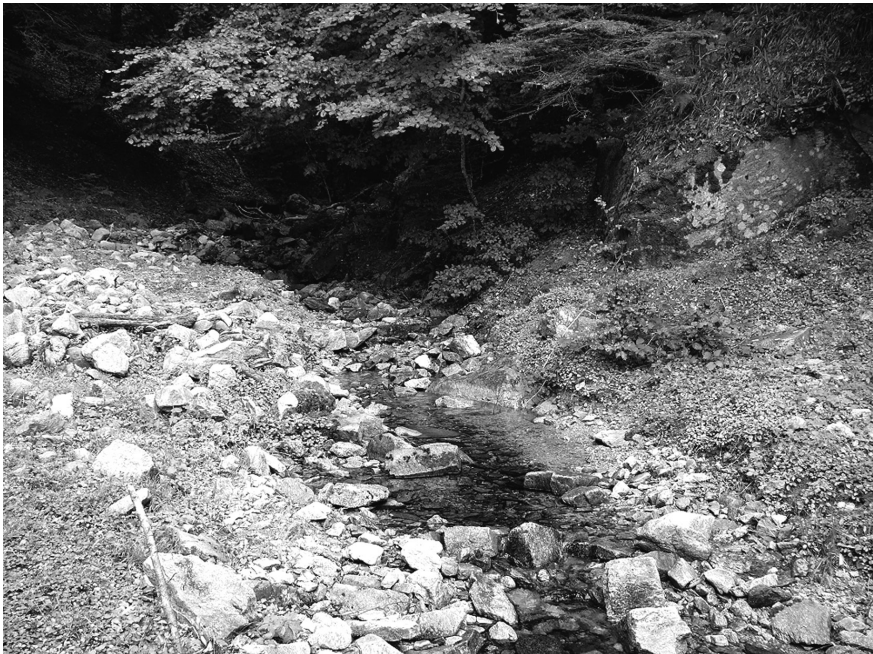
Abbildung 3: Kleiner Bach im Aspromonte-Gebirge (ca. 1.050 m ü.M.) in Süd-Kalabrien, Italien, Fundort von Cordulegaster bidentata sicilica (06.08.2010). – Figure 3: Rivulet in the mountains of Aspromonte (ca 1,050 m a.s.l.) in southern Calabria, Italy, where Cordulegaster bidentata sicilica was recorded (06-iv-2010).

Habitat: An drei Tagen wurden mehrere kleine Bäche und Rinnsale im Bereich des Aspromonte in der Nähe von Sanatorio (950-1.200 m ü.M.) aufgesucht. Bei den Gewässern in dieser Region handelt es sich meist um Quellbäche (z.B.