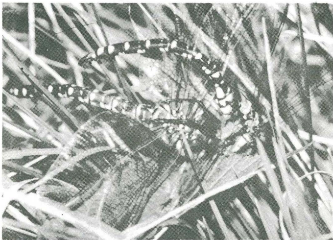
Abb. 2: Ein Aeshna cyanea ♂ ging nach dem Ergreifen eines Aeshna juncea ♀ zu Boden, das artfremde ♂ flog kurz darauf allein auf, das ♀ blieb noch etwa 5 min allein sitzen, zu einer Radbildung kam es also nicht (Heideweiher Dahlemer Binz b. Blankenheim/Eifel, 18.9.1982)

(Heideweiher im Ruderalgelände am Flugplatz Dahlemer Binz bei Blankenheim/Eifel, 18.9.82, 13.00 Uhr, sonnig: es fliegen 4-5 ♂ von Aeshna cyanea , 1 ♀ Eier legend, und zeitweilig je 1 ♂ von Aeshna juncea und Ae. mixta neben einzelnen Lestes sponsa und Sympetrum danae sowie je 1 ♂ von S. vulgatum und striolatum ). Ein ♀ von Aeshna juncea legt in Ufernähe versteckt zwischen Seggen Eier ab, beim Auffliegen wird es von dem dort patrouillierenden Aeshna cyanea ♂ angefliegen, beide stürzen am Ufer in das Gras: das ♂ hat das ♀ mit den Beinen am Thorax von oben her gepackt (Abb. 2). Es gelingt dem ♂ jedoch nicht, mit dem ♀ aufzulegen: das ♀ bleibt noch eine Weile allein sitzen, ehe es in die Gewässerumgebung verschwindet. Hier war offensichtlich die Artschranke wirksam.