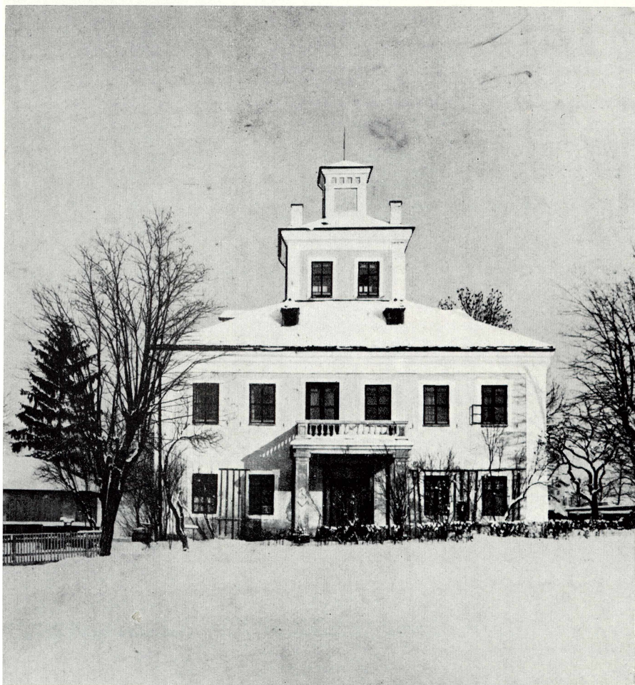
Abb. 2 Ansicht des Pfarrhofes von Süden Photographie aus dem letzten Viertel des 19. Jahrhunderts