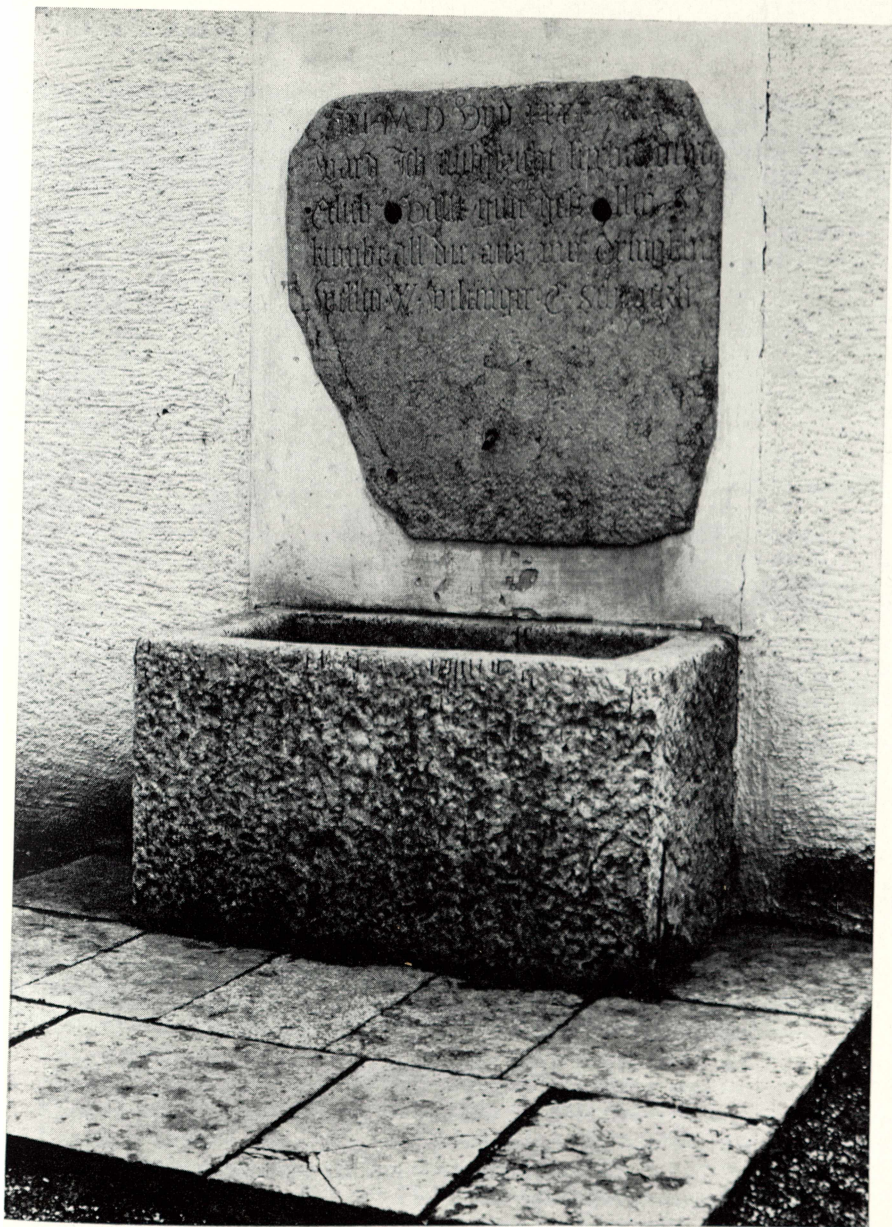
Abb. 1 Brunnentafel an der Gartenmauer des Pfarrhofes