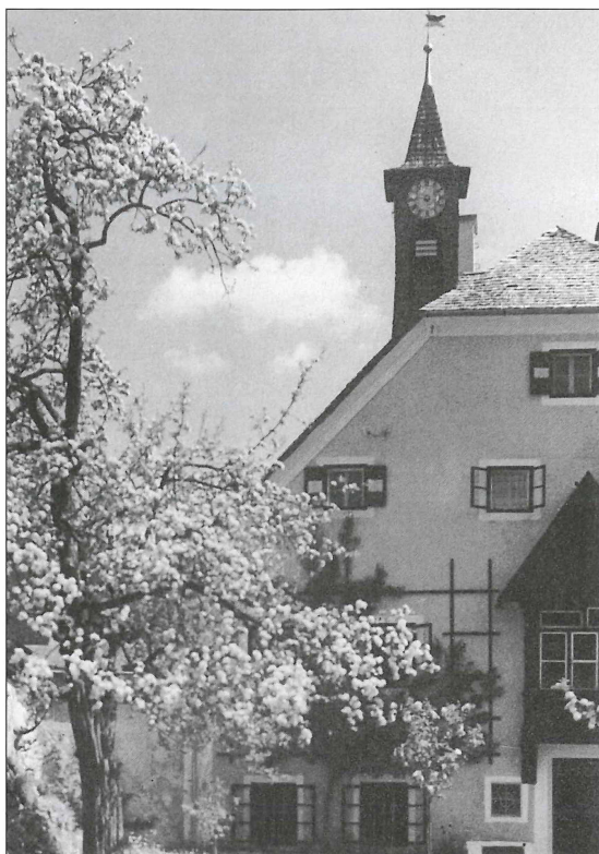
Forstverwaltungsgebäude Mühlbach im Pinzgau.

Pinzgau zusammengeschlossen. Der Sitz ist in Mittersill, der Besitzstand beträgt 71.500 ha.