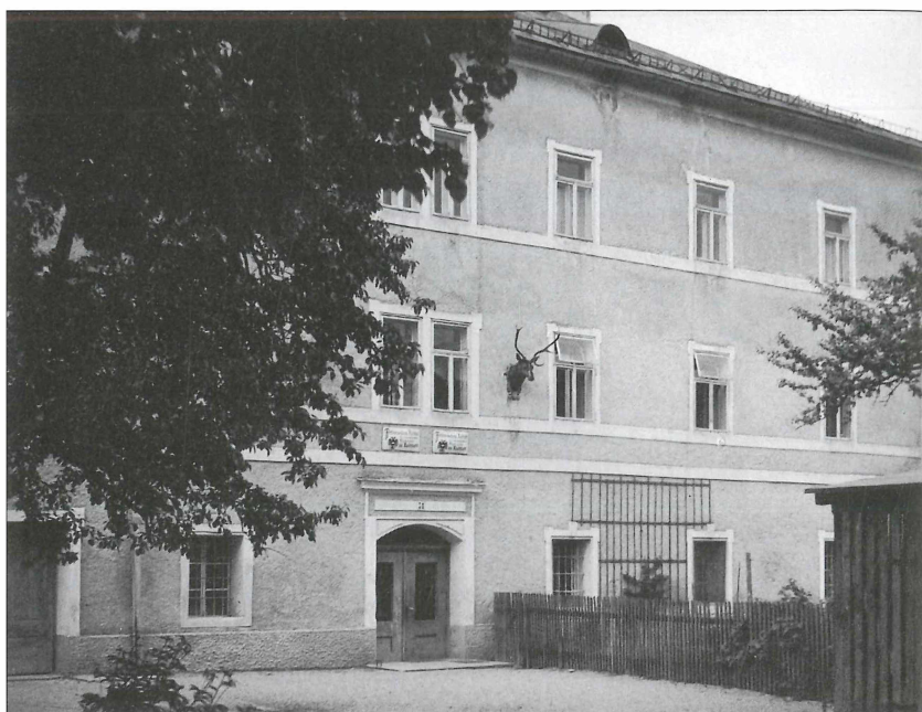
Forstverwaltungsgebäude Flachau und Radstadt in Radstadt.

Radstadt zirka 4960 ha (Wald 4360 ha). Im Jahr 1980 wurden die beiden Forstverwaltung vereinigt, wobei der Försterdienstbezirk Reitdorf an die Forstverwaltung Eben abgetreten wurde. Am 1. Januar 1997 wurde die Forstverwaltung Eben an die Forstverwaltung Radstadt angeschlossen. Mit Überführung der Österreichischen Bundesforste in die ÖBf AG wurden Teile der Forstverwaltungen St. Johann und Bischofshofen an den Forstbetrieb Radstadt angeschlossen.