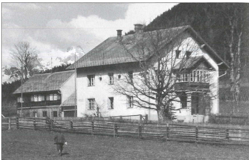
Forstverwaltungsgebäude St. Martin am Tennengebirge.