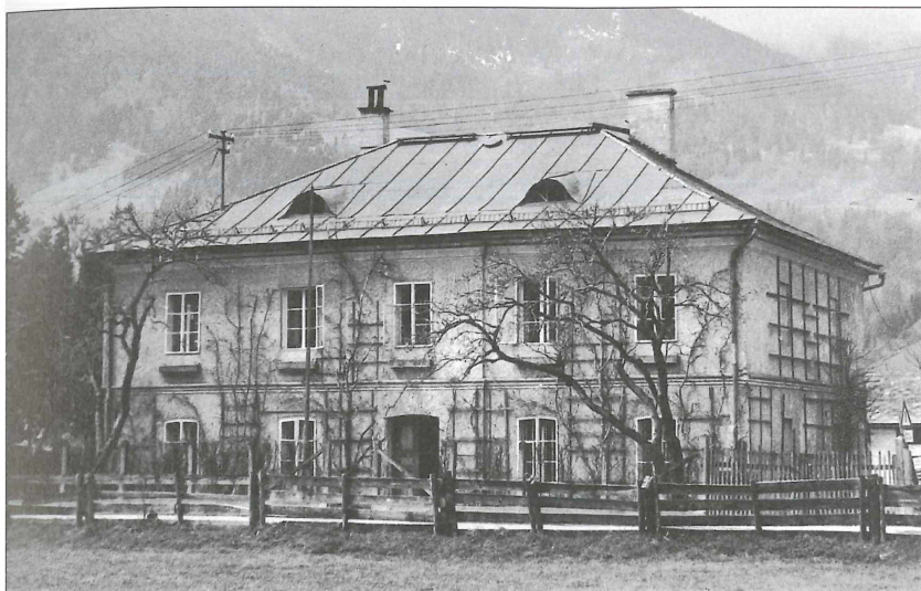
Forstverwaltungsgebäude St. Johann im Pongau.

gen Bauparzelle 29 ein Forsthaus des k.k. Montan-Ärars stand. Ab 1867 war dieses Gebäude im Besitz des k.k. Ärars und Sitz einer Forstverwaltung, der bis etwa 1873 auch der ärarische Wald im Großarlal angehörte. Um 1923 war das Haus Eigentum des österr. Bundesschatzes und von 1941 bis 1945 Sitz der Reichsforstverwaltung St. Johann. 1947 kam das Gebäude in den Besitz der Republik/Österreichische Bundesforste und wurde 1981 im Zuge der Angliederung der FV St. Johann an die FV Großarl an die Bundesgebäudeverwaltung gegen ein Grundstück in St. Johann/Zaglau, etwas abseits des Zentrums, getauscht. Das Gebäude wurde 1981/82 abgerissen, der Platz dient heute dem Bundesrealgymnasium als Sportplatz.