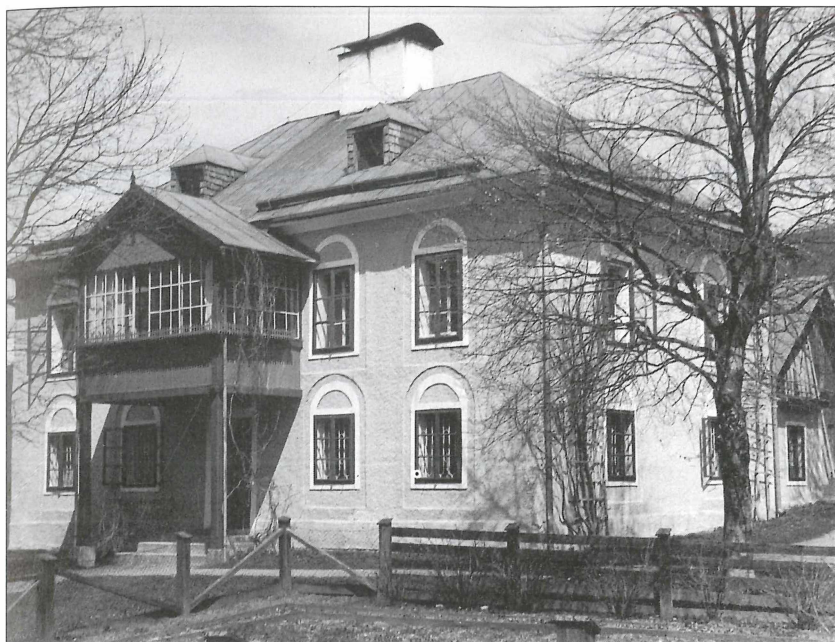
Oben: Forstverwaltungsgebäude Abtenau, unten: Bischofshofen.