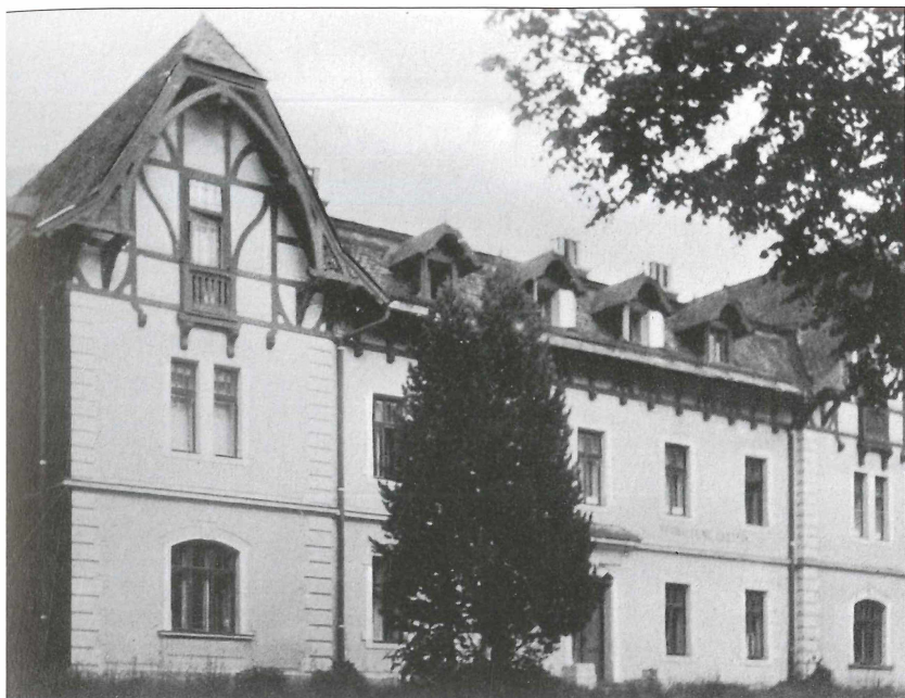
Forstverwaltungsgebäude Gastein in Bad Hofgastein.

Das Gebiet der Forstverwaltung Gastein wurde 1873 der k.k. Forst- und Domänenverwaltung Salzburg zugeordnet. Die damalige Forstverwaltung Gastein hatte eine Besitzstand von ca. 9700 ha (Wald 6300 ha) und war in vier Försterdienstbezirke — Bad Gastein, Hofgastein I und II (später Angertal) und Dorfgastein — untergliedert. Mit 1. Januar 1995 wurde die FV Gastein mit der FV Schwarzach vereinigt und ab 2004 dem Forstbetrieb Pongau mit Sitz in St. Johann angegliedert. Im Gasteiner Tal sind heute die Forstreviere Bad Gastein und Dorfgastein zuständig.