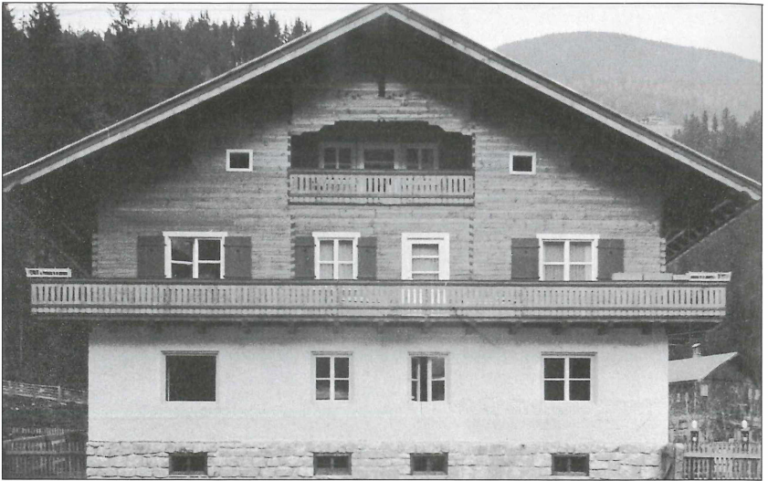
Forstverwaltungsgebäude Wald im Pinzgau.

Krimmler Wasserfällen gehört als höchster Punkt der Forstverwaltung der Großvenediger (3674 m) heute teilweise zum Nationalpark Hohe Tauern. 1982 wurde die Forstverwaltung Wald aufgelöst und der FV Mühlbach im Pinzgau angeschlossen. Diese wurde in weiterer Folge ebenfalls aufgelöst und mit der Forstverwaltung Mittersill vereinigt. Heute gehört das ganze Gebiet zum Forstbetrieb Pinzgau der ÖBf AG.