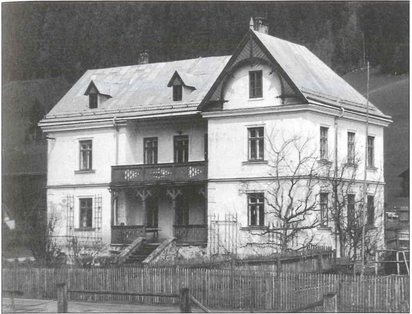
Forstverwaltungsgebäude Eben im Pongau.