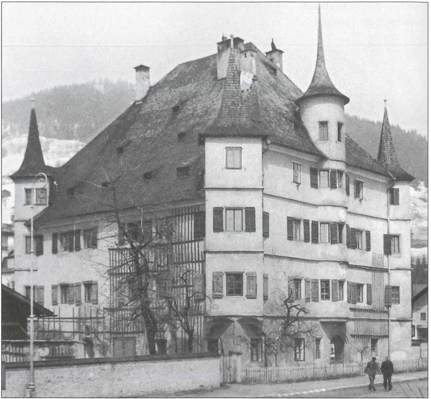
Forstverwaltungsgebäude Piesendorf und Zell am See in Zell am See.

und Neukirchen Mühlbach angegliedert. 1997 erfolgte die Vereinigung der Forstverwaltungen Mühlbach und Mittersill zur Forstverwaltung Mittersill.