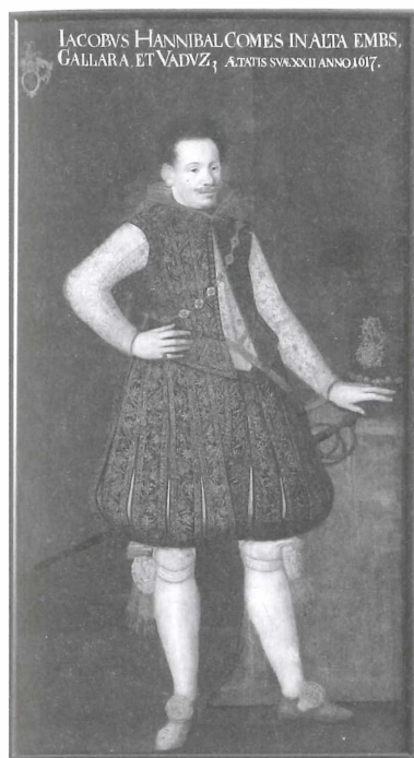
Abbildung 4a: Anonym, Porträt Jakob Hannibal II. von Hohenems, Polička/Tschechische Republik, Städtisches Museum und Galerie