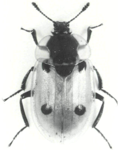
Abb. 2 (links): Platycerus caraboides – eine Hirschkäferart, die sich in alten, anbrüchigen Laubbäumen entwickelt. (2,5-fach vergrößert) Abb. 3 (rechts): Xylodrepa quadripunctata – eine auf Laubbäumen räuberisch lebende Art aus der Familie der Aaskäfer. (3-fach vergrößert)

b) in hohlen Stamm- und Asteilen lebende Käferarten: im Mulm, der sich in Baumhöhlen ansammelt, entwickeln sich u. a. Larven verschiedener Rosen- und sonstiger Blatthornkäfer; auch diesen Tieren wird mit dem Rückgang alter Bäume zunehmend der Lebensraum entzogen. Gefährdet sind vor allem Liocola lugubris HBST., Potosia aeruginosa DRURY, P. fieberi KR., Osmoderma eremita SCOP., Gnorimus nobilis L. und G. octopunctatus F.