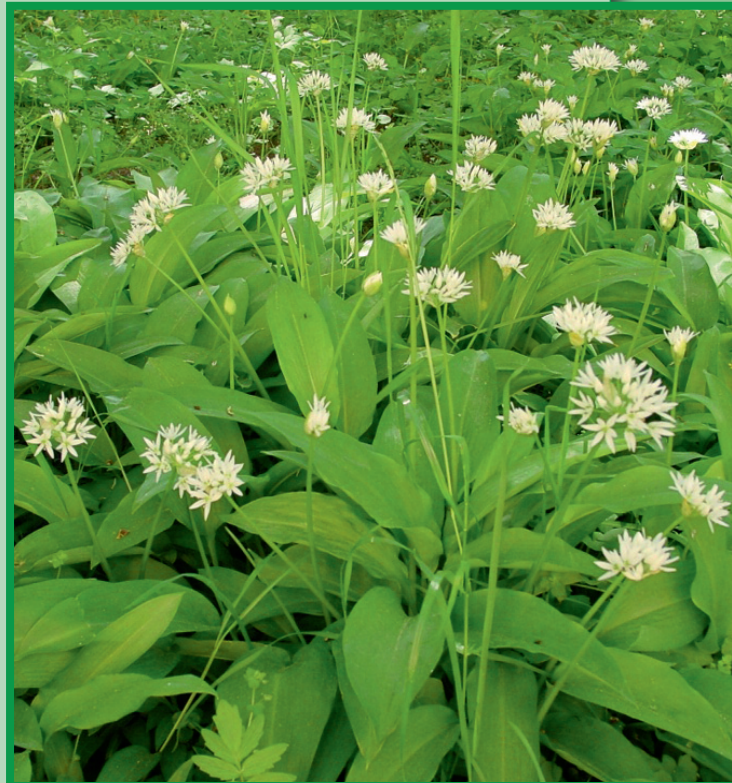
Allium ursinum – Bärlauch