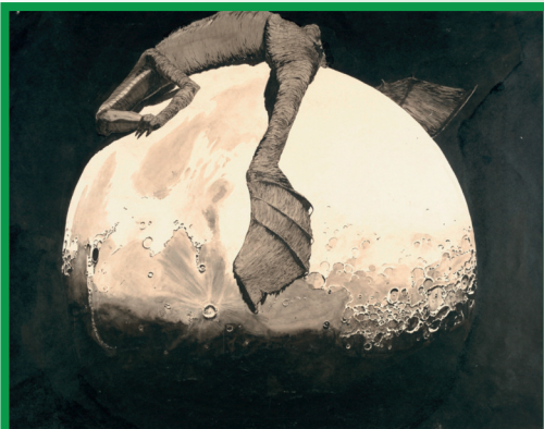
Klemens Brosch, Krokodil auf der Mond-scheibe , um 1911, Tusche auf Papier, 47 x 57 cm