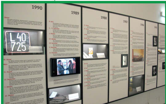
Zeitstreifen in der Ausstellung „Das 20. Jahrhundert in Oberösterreich“ im Schlossmuseum Linz.