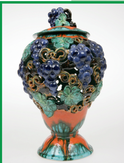
Keramik aus St. Peter bei Freistadt.

Ausstellungsdauer: 20. April. bis 3. November 2013, Mühlviertler Schlossmuseum Freistadt