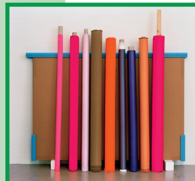
Judith Huemer, Vielheit , 2012, C-Print, 88 x 90 cm

Ausstellungsdauer: 14. März bis 5. Mai 2013