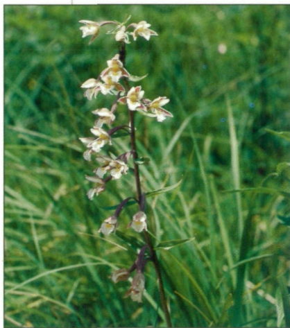
Epipactis palustris