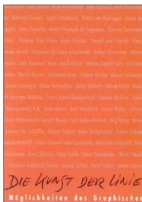
Katalogcover: Grafik: Gottfried Hattinger