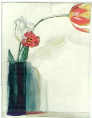
Vase mit Tulpe, Therese Raab, 1906