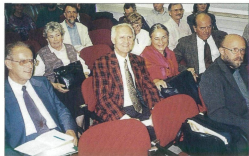
Tagung zur Geschichte der Entomologie im Biologiezentrum.

Gleich zweimal war Linz in den vergangenen Wochen Schauplatz nationaler und internationaler insektenkundlicher Tagungsaktivitäten. Am 17. Okto-