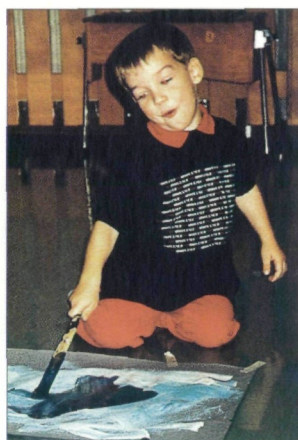
Weihnachtsausstellung in der Kindergalerie. Die Kinder vom Kindergarten Hermenhof in Wels präsentieren im Rahmen einer Weihnachtsausstellung in der Kindergalerie der Landesgalerie Gefühlsbilder zum Thema Licht.

Dauer der Ausstellung: 12. Dezember 1998 bis 31. Jänner 1999.