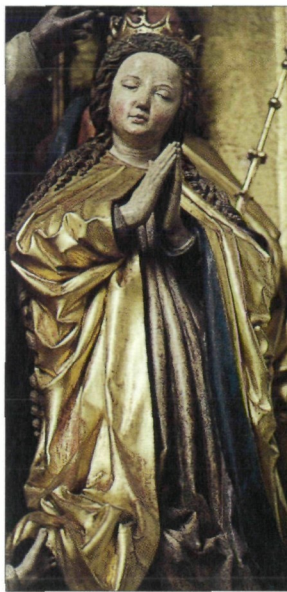
Ein Hauptwerk Michael Pachers: Maria aus dem Schrein des ehemaligen Hochaltars der Alten Pfarrkirche von Gries bei Bozen, 1471/75