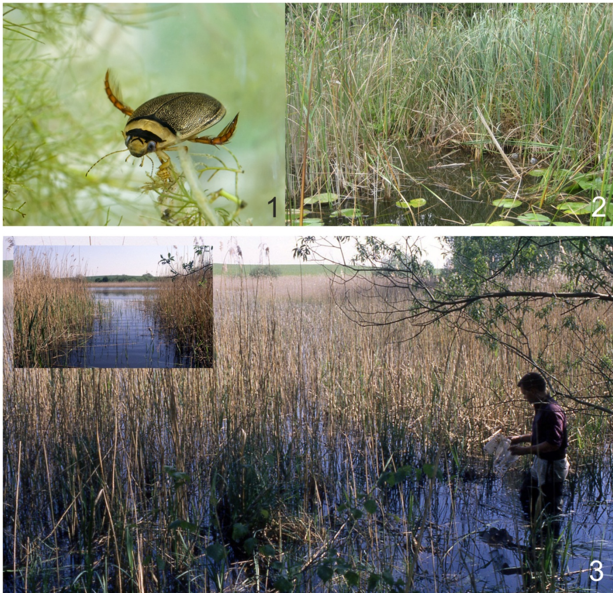
Abb. 1-3: 1) Ein Männchen des Schmalbindigen Breitflügel-Tauchkäfers Graphoderus bilineatus (DE GEER, 1774); 2) FND Kölpinsee östlich Rheinsberg. Lebensraum des G. bilineatus im Naturpark Stechlin-Ruppiner Land.; 3) Der Dolgensee, ein natürlich eutropher Flachsee östlich von Warnitz.

Dolgensee, FND Kölpinsee, Kolbatzer Mühlenteich), als auch in sauren Gewässern (Wittmannsdorf, Tröbitz) zu finden ist.