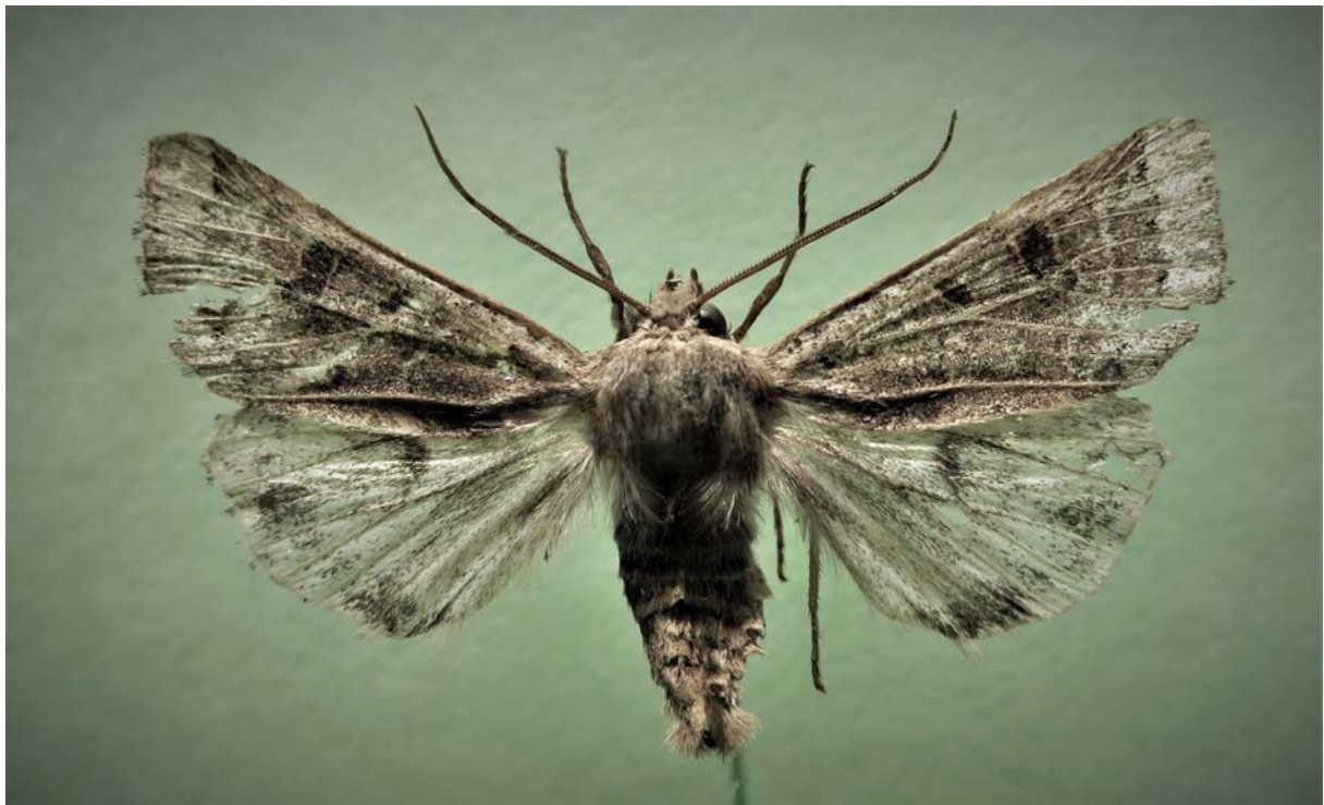
Abb. 1: Männlicher Falter von Agrochola lunosa (HAWORTH, 1809), Schmachtenhagen-Ost bei Oranienburg (MTB 3246), 25.IX.2019

Agrochola lunosa ist eine atlanto-mediterran verbreitete und Wärme liebende Art, die von Nordwestafrika über Spanien, Portugal und Frankreich bis nach Großbritannien und Irland und in die Beneluxstaaten verbreitet ist (RONKAY et al. 2001, GAEDIKE et al. 2017). Die expansive Art erweiterte schon im letzten Jahrhundert ihr Areal nach Nordosten und wurde 1935 erstmalig in Deutschland am Niederrhein nachgewiesen. Von dort erfolgte eine weitere Ausbreitung im Rheintal nach Süden bis nach Baden-Württemberg (Erstnachweis 1978), aber auch nach Nordosten nach Niedersachsen, Schleswig-Holstein und an die dänische Westküste (STEINER 1997, RONKAY et al. 2001, GAEDIKE et al. 2017). In den ostdeutschen Bundesländern wurde die Art erstmalig bei Bitterfeld (Sachsen-Anhalt) im Jahr 2008 durch Sterl nachgewiesen (STERL 2010, SCHÖNBORN & LEHMANN 2018). Diesen Fund kann man vorsichtig als Ergebnis einer weiteren Ostexpansion von A. lunosa bewerten, möglicherweise aus dem nordwestdeutschen Raum über das Elbtal nach Südosten. Diese Vermutung wird durch einen Erstnachweis von A. lunosa im Land Brandenburg unterstützt. Am 25.IX.2019 fing der Erstautor einen schon stärker geflogenen Falter (Abb. 1) beim Hauslichtfang in seinem Garten nördlich von Berlin (Abb. 2).