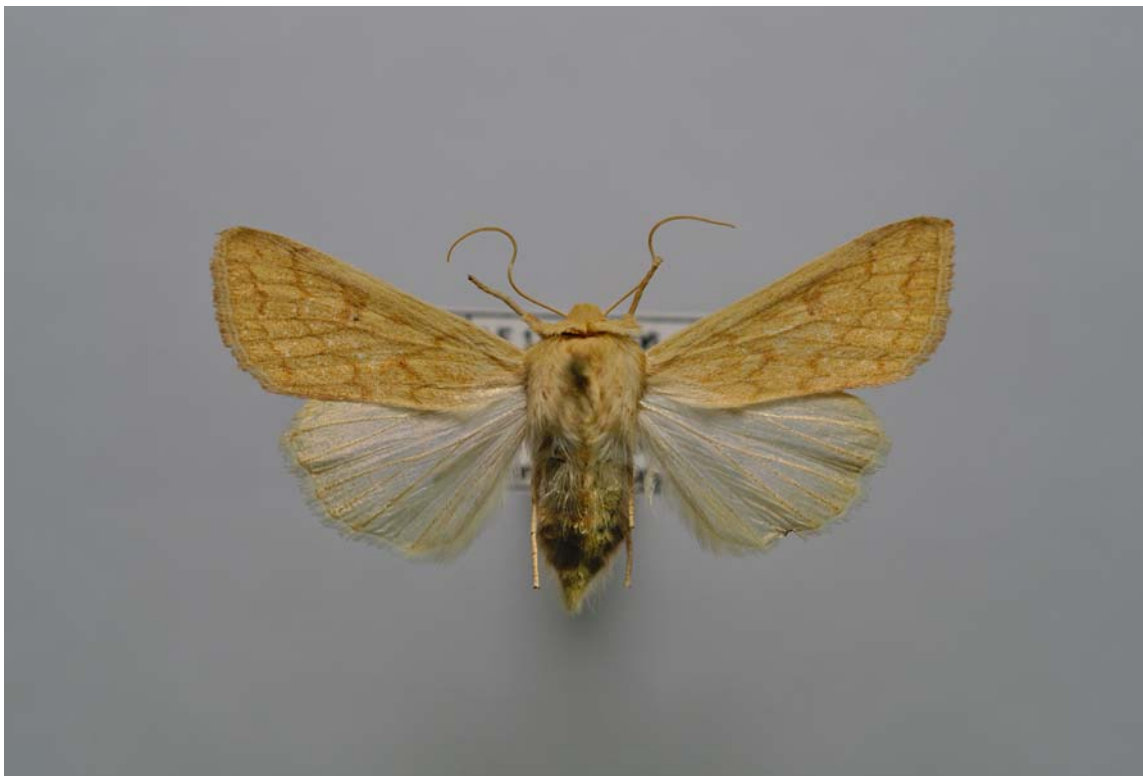
Abb. 1: Falter von Mythimna vitellina , Niedergörsdorf bei Jüterbog (MTB 4043), 19.IX.2006, leg. Rödel & B. Schulze, (Foto et coll. Rödel) - Erstnachweis für Brandenburg.

Alle Brandenburger Beobachtungen werden in der folgenden Übersicht zusammengefasst und die Lage der Nachweise in Abb. 2 dargestellt.