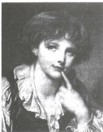
J. B. Greuze: Espèglerie