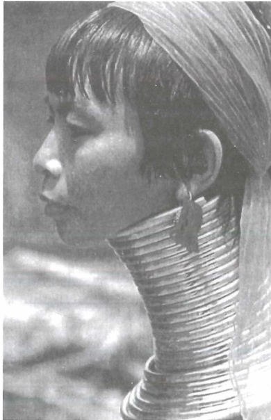
Abbildung 1: Frau mit Giraffenhals . Das Foto ist genommen aus "Desmond Morris: Mars und Venus" (vgl. Literaturverzeichnis und im Text Seite 185 mit Hinweis auf Morris Seite 45; die genaue Seitenangabe für das Bild wäre allerdings Seite 43).

Schon oben wurden „weibliche“ Signale des Halses erwähnt. Das Schönheitsmerkmal des geschlechtsspezifisch oder zumindest geschlechtstypisch schlanken Halses und der weibliche Gestus des Kehlezeigens führen dementsprechend oft zu höchst luxuriertem Schmuck. Man findet ihn etwa bei den Porträtfiguren der Dan. Bei diesem afrikanischen Stamm „verlangen Männer zuweilen von einem Künstler eine Skulptur, die der von ihnen geliebten Frau möglichst ähnlich sein [soll], d.h. die Merkmale, auf die es ankommt, besonders prägnant sichtbar machen soll.“ (Kramer, F.W. 1997, 177.) Manche Männer bevorzugen einen kräftigen Typus, andere einen grazilen. Immer gleich bleibt aber das Artefakt des äußerst beengenden Halschmuckes. Ein noch extremerer Halsschmuck, der oft als „erstarrte Gebärde“ interpretiert wurde, sind die „Giraffenhäse“ der Frauen Ost-Burmas. (Abb. 1.) Wie sie mit diesen erstaunlichen