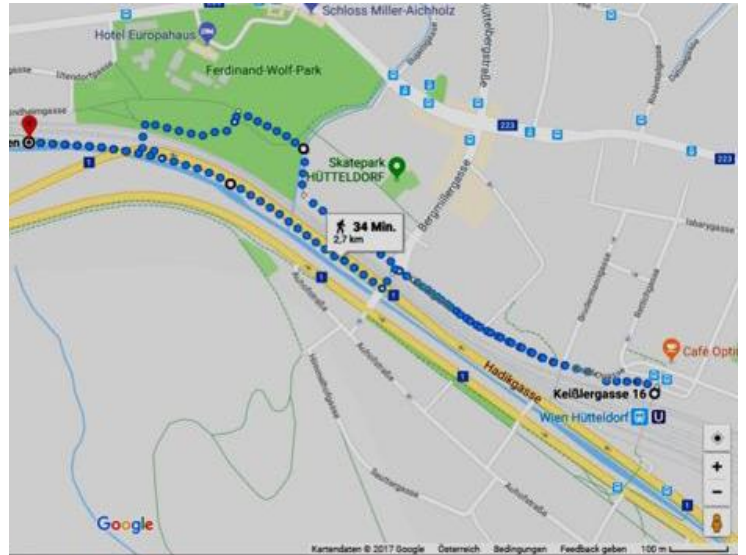
Abbildung : Google Maps Ansicht der phykologischen Exkursionsroute, welche an der U4 Station Wien Hütteldorf beginnt und zur renaturierten Strecke des Wienflusses führt - (A) U4 Station Wien Hütteldorf, Keißergasse 16; der Eingang der Station ist der Beginn der Exkursionsroute; (B) der Halterbach am Ferdinand-Wolf-Park; (C) Die nicht-renaturierte Strecke des Wienflusses; (D) Ende der Route - die renaturierte Strecke des Wienflusses.

Wir freuen uns über zahlreiche Teilnahme und bitten um Anmeldung per E-mail bis spätestens 3 Tage vor Exkursionsbeginn.